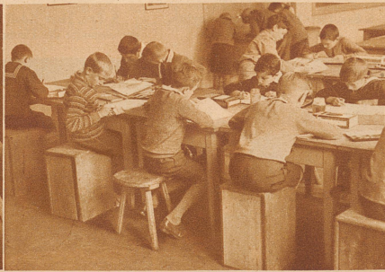
Immer mehr Kinder müssen in einem Zeichensaal arbeiten; es sind längst nicht mehr genügend Stühle da. Die Not macht aber erfinderisch: die Kinder sitzen auf alten umgestürzten Holzkisten