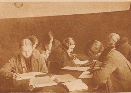
Oft ist das Klassenzimmer nicht genügend geheizt und die Kinder frieren; wer einen Wintermantel hat, behält ihn auch während der Schulstunden an