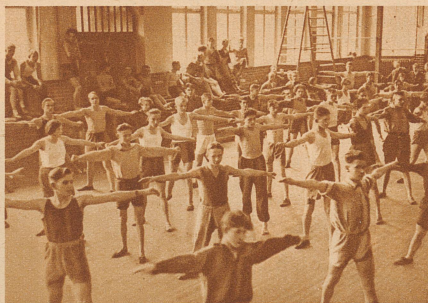
Die Turnsäle sind jetzt, wo die Klassen so groß sind, immer überfüllt. Für alle miteinander ist überhaupt kein Platz; ungefähr ein Viertel der Klasse muß immer zuschauen, während die anderen turnen. Dann lösen sie sich wieder ab

Einen herzlichen Gruß vom Unggle Redakter.