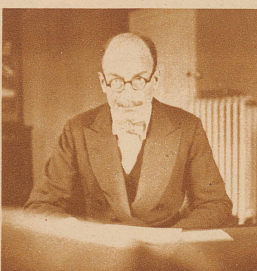
S. Exz. Sir Howard Kennard, der Gesandte von Großbritannien