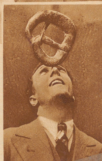
In München war es einmal eine Brezel an Stelle der Bälle

Ein menschliches Wunder, das Abend für Abend Tausende von Menschen in Erstaunen und Entzücken versetzte, ist nicht mehr. Ein Zauberer, ein Magier schien er, dem die Materie gehorchen mußte, für den es weder Schwerkraft, noch Beharrungsvermögen der toten Dinge gab. Die Bälle und Ringe,