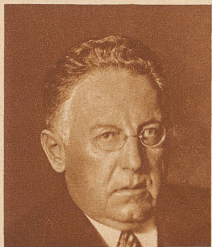
Dr. Roman Abt, Wohlen (B.G.B.) Nationalratspräsident für 1932