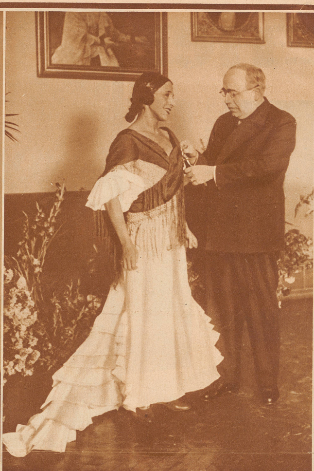
Der erste Orden der spanischen Republik ist soeben verteilt worden; ihn erhielt kein Staatsmann, kein Gelehrter, kein Militär, sondern die wunderschöne Tänzerin La Argentina , die in ganz Europa geliebt wird. Die Auszeichnung ist durchaus gerechtfertigt; wenige haben so dazu beigetragen, Sympathie für Spanien zu werben wie diese in ihrer Kunst durch und durch spanische Frau