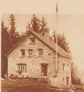
Das neue Klubhaus Schwarzenberg am Fuße des Piz Sol ob Mels, das dem Neuen Skiklub Zürich gehört und am 29. November eingeweiht wurde