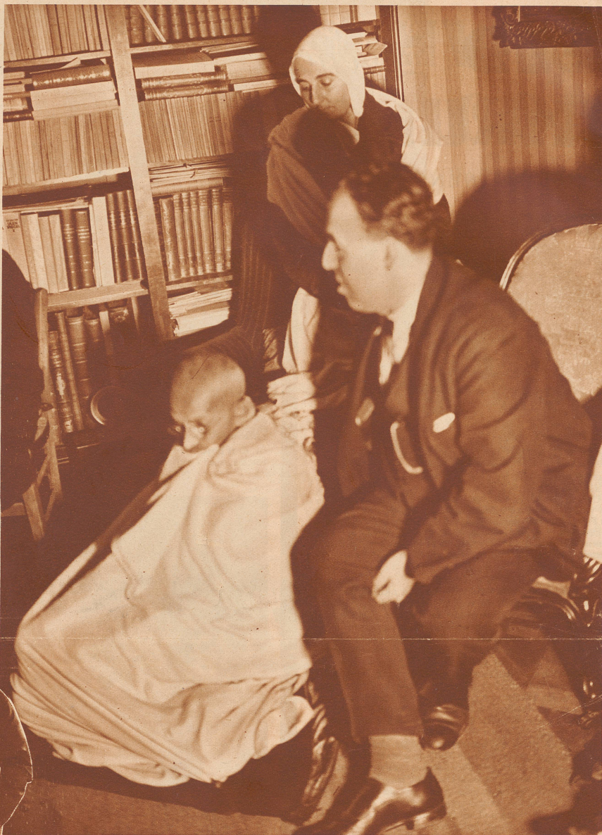
Gandhi im Hause Romain Rollands in Villeneuve

Ungeheures Aufsehen erregte in Deutschland und im Ausland die Tatsache, daß Adolf Hitler am 4. Dezember im Hotel «Kaiserhof» in Berlin für die englischen und amerikanischen Pressevertreter einen offiziellen Empfang veranstaltete, in dem er sie über das Verhalten seiner Partei zum Ausland bei der bevorstehenden Machtergreifung, an der er nicht mehr zu zweifeln scheint, informierte. — Hitler mit Hauptmann Goering