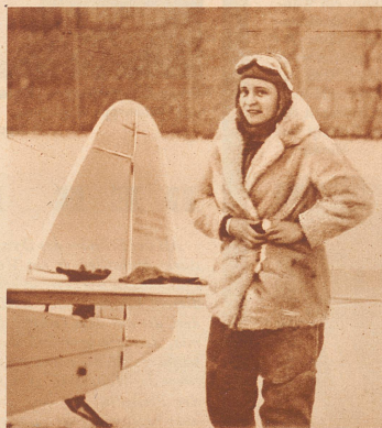
Elli Beinhorn , die durch ihren Afrikaflug bekannt gewordene deutsche Fliegerin, unternimmt jetzt einen Raid nach der Südsee. — Die kühne Fliegerin vor dem Start in Berlin am 4. Dezember