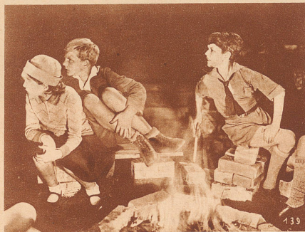
In dem Hof vom Hotel, in dem der Dieb wohnt, müssen ein paar Kinder immer Wache halten, damit er nicht entweichen kann. In der Nacht wird es kalt und sie machen ein kleines Feuer