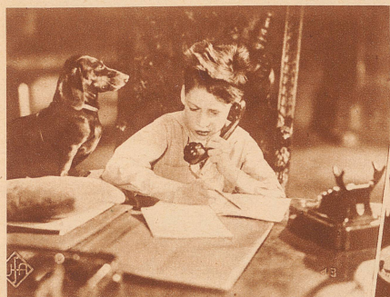
Einer, dessen Eltern ein Telefon haben, wird zur «Nachrichtenzentrale». Er freut sich ja nicht gerade, daß er immer zu Hause sitzen muß; aber sein Dackel leistet ihm Gesellschaft