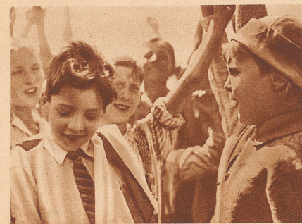
Die Kinder haben gesiegt!