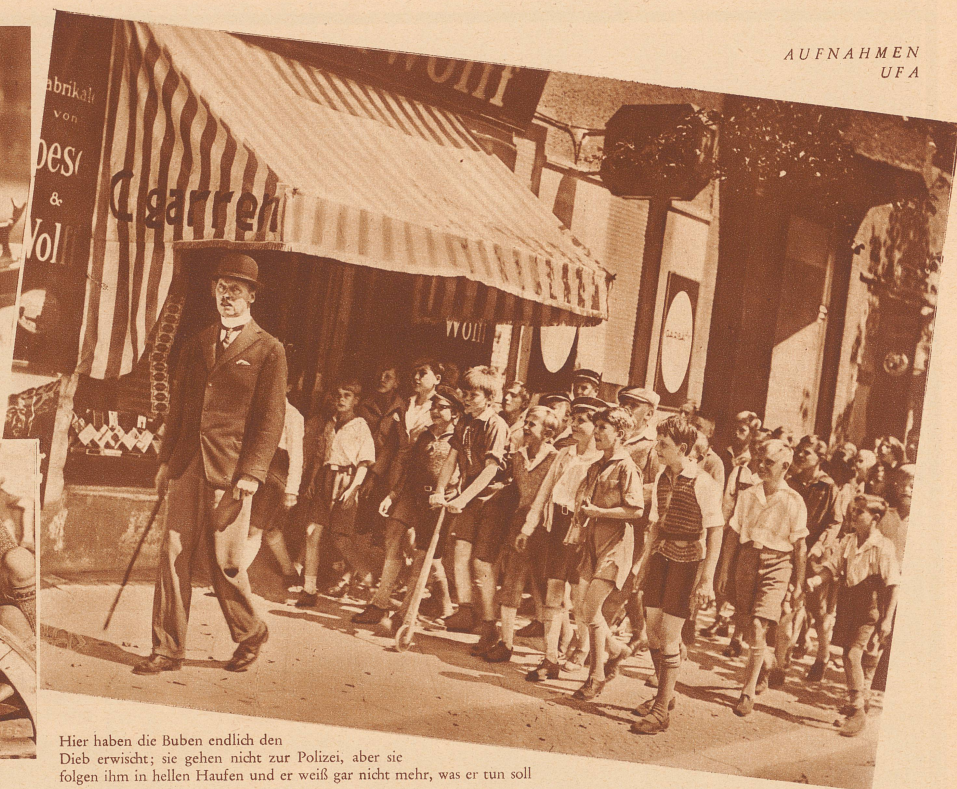
Hier haben die Buben endlich den Dieb erwischt; sie gehen nicht zur Polizei, aber sie folgen ihm in hellen Haufen und er weiß gar nicht mehr, was er tun soll