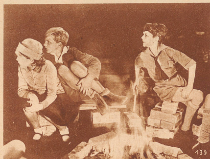
In dem Hof vom Hotel, in dem der Dieb wohnt, müssen ein paar Kinder immer Wache halten, damit er nicht entweichen kann. In der Nacht wird es kalt und sie machen ein kleines Feuer