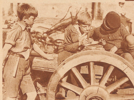
Der Kriegsplan! Der Oberleiter hat aufgezeichnet, welche Hotels bewacht werden müssen und erklärt es den anderen