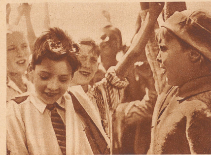
Die Kinder haben gesiegt!