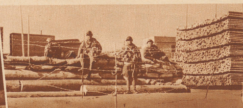
Italianische, Marine-Soldaten bewachen in den Straßen von Tientsin die von ihnen errichteten Barrikaden