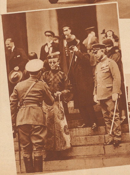
Bild links: Herr Henry Pu Yu, der früher Hsuan Tung hieß und Kaiser von China war, bei einer offiziellen Feierlichkeit in Tientsin. In weiten Kreisen, besonders in England, wird angenommen, daß er in der allernächsten Zeit Kaiser der von China abgetrennten Mandschurei werden wird

Es scheint fast, als ob sich in der Mandschurei das Bild, das China während des Boxer-Aufstandes bot, wiederholen sollte: die Truppen aller möglichen europäischen Mächte, die ihre Stellung in China bedroht fühlen, beteiligen sich in noch nicht geklärtem Ausmaß am Kampf