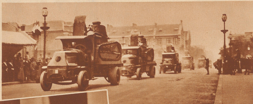
Französische Tanks in einer Straße von Tientsin

Es scheint fast, als ob sich in der Mandschurei das Bild, das China während des Boxer-Aufstandes bot, wiederholen sollte: die Truppen aller möglichen europäischen Mächte, die ihre Stellung in China bedroht fühlen, beteiligen sich in noch nicht geklärtem Ausmaß am Kampf