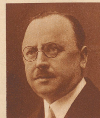
Nationalrat Jos. Escher

Notar, Advokat und Gemeindepräsident von Brig und Glis, ist an Stelle des durch Unglücksfall verstorbenen Regierungsrat Walpen in die Walliser Regierung gewählt worden