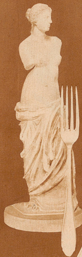
No. 2 Faden- muster

J E Z L E R B R I N G T S C H Ö N H E I T I N J E D E S H A U S