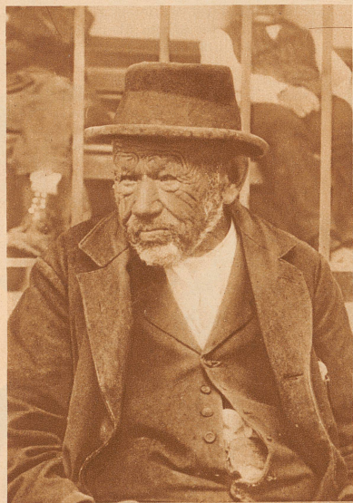
Er war viel an Wind und Wetter. Es ist hart, am Ende eines arbeitsreichen Lebens nichts zu besitzen