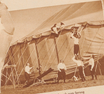
6 Es lebt der Dreh-Impuls vom Sprung Und dann von der Beschleunigung.