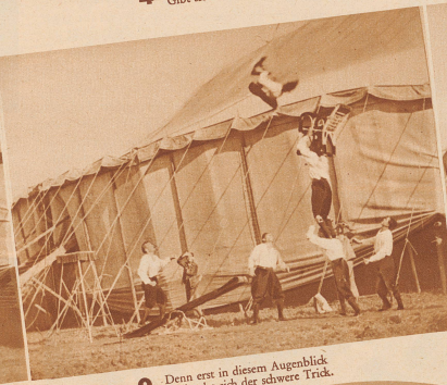
9 Denn erst in diesem Augenblick Vollendet sich der schwere Trick.