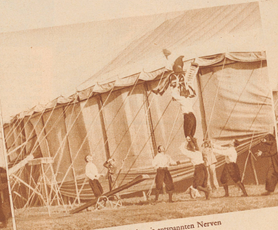
12 Jetzt kann sie mit entspannten Nerven Sich in den hohen Sessel werfen.