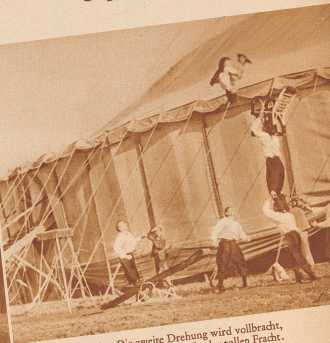
10 Die zweite Drehung wird vollbracht, Es stirbt die Wucht der tollen Fracht.