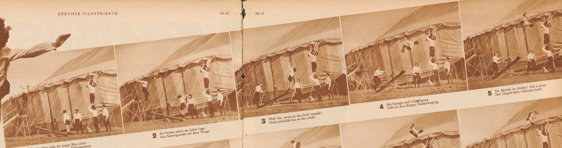
1 Hier steht ein junges Blut adrett Und mutig auf dem Schleuderbrett.