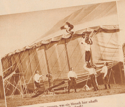
7 Wir staunen, was ein Mensch hier schafft Mit Eleganz und Willenskraft!