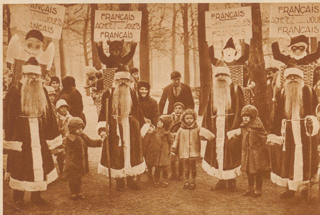
Weihnachtsmänner tragen auf den großen Boulevards von Paris Plakate mit der Aufschrift: «Franzosen, kauft französisches Spielzeug!»