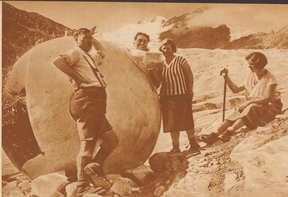
Streit um Piccards Gondel. Um die Aluminiumgondel Professor Piccards, die seit dem denkwürdigen Stratosphärenflug im Mai dieses Jahres auf dem Gurgler Ferner liegt, ist ein Streit entstanden. Verehrer Piccards in Brüssel möchten die Reliquie auf dem Gletscher bergen und sie nach Belgien in ein Museum bringen, die Bewohner von Gurgl wollen sie nicht hergeben, da sie für den Ort eine große Sehenswürdigkeit und ein gutes Lockmittel für fremde Besucher geworden ist. Unser Bild zeigt die Gondel auf dem Gurgler Ferner mit einer Anzahl Touristen