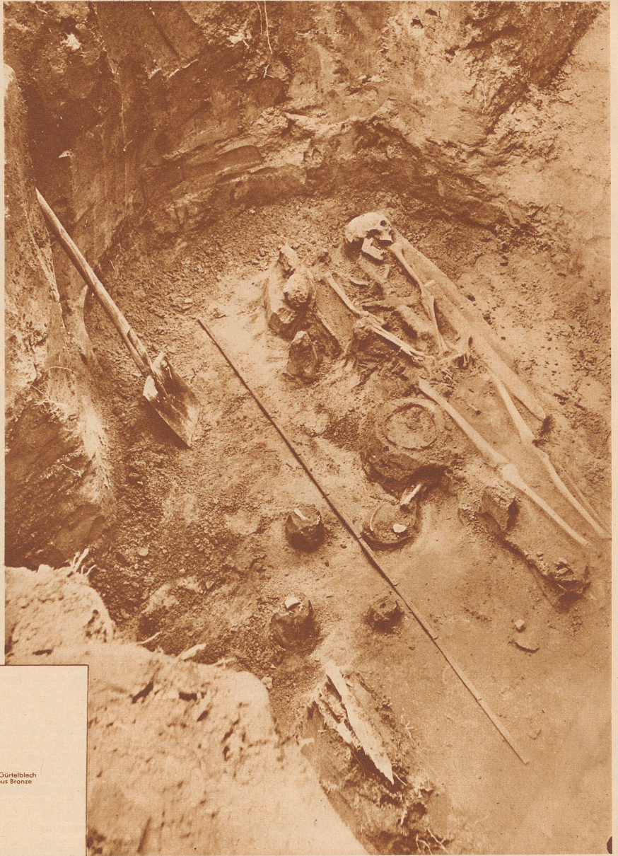
Das Skelett eines alemannischen Kriegers, der in voller Rüstung bestattet wurde. Zu seinen Waffen gab man ihm Gebrauchsgegenstände, wie Feuerzeug, Messer und Ahle, sodann in einem Topf eine Wegzehrung und daneben ein Stück Schweinefleisch mit. Auf kultische Handlungen deuten rote Tontückchen und Ascheteilchen hin, die ins Grab gestreut wurden