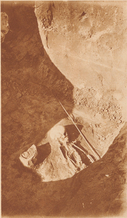
Grab eines Kindes (Mädchen), das einen Topf, eine Halskette aus Bernsteinchen, einen durchbohrten Bärenzahn und eine Silbermünze des ostgotischen Königs Totila (541 bis 552 n. Chr.) enthielt. (Neben dem Skelett ein moderner Meterstab)