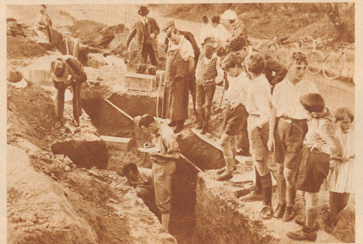
Die Ausgrabungen am Bernerring locken viele Neugierige herbei, die mit großem Interesse die Arbeiten verfolgen

Beim Bau einer neuen Straße am Bernerring in Basel wurde ein bisher völlig unbekanntes alemannisches Gräberfeld aus der zweiten Hälfte des 6. Jahrhunderts entdeckt. Das historische Museum Basel konnte 17 Einzelgräber bloßlegen und fachgemäß untersuchen lassen.