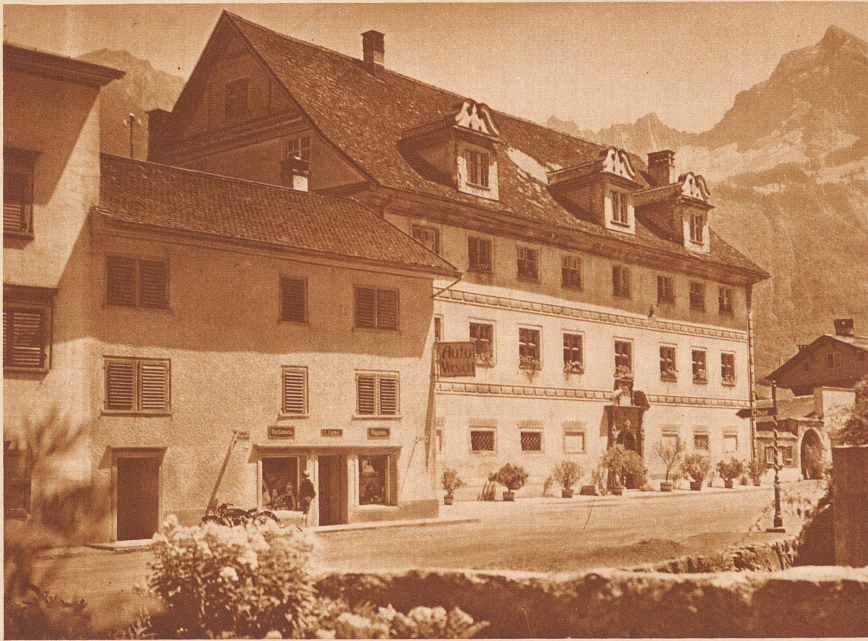
Der Freuler-Palast in Näfels

Das bedeutendste Dokument der Hochrenaissance im Kanton Glarus. Erbaut 1637-1646