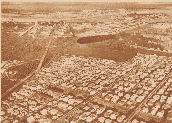
Der Zeppelinschatten über Archangelsk, der Stadt im höchsten Norden Rußlands, wo Samoilowitsch seine Verbannungzeit verlebte. Im Vordergrund die mächtigen Holzlager der russischen Staatsverwaltung

Unser Landsmann W. Bosshard hat im Auftrage der «Berliner Illustrirten Zeitung» als einziger Bildberichter- statter die Expedition mitgemacht