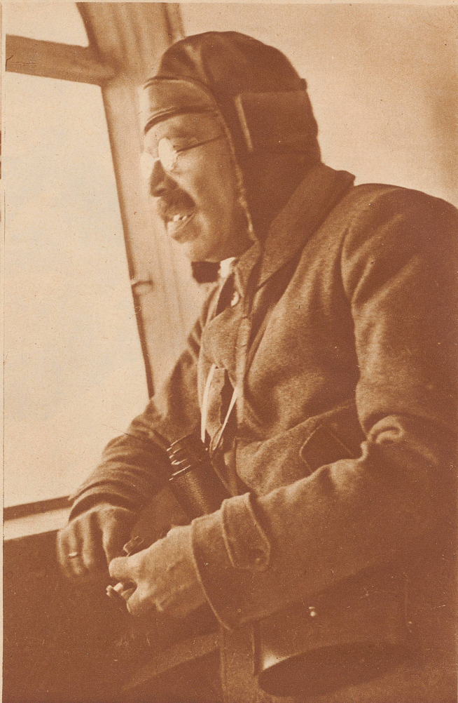
Professor Samoilowitsch hält am Fenster der Kabine Ausschau nach unbekannten Inseln im Eismeer

Ein bisher unbekannter Gebirgszug auf Nordland (früher Nikolaus II-Land), der während des Polarfluges von Professor Samoilowitsch entdeckt wurde