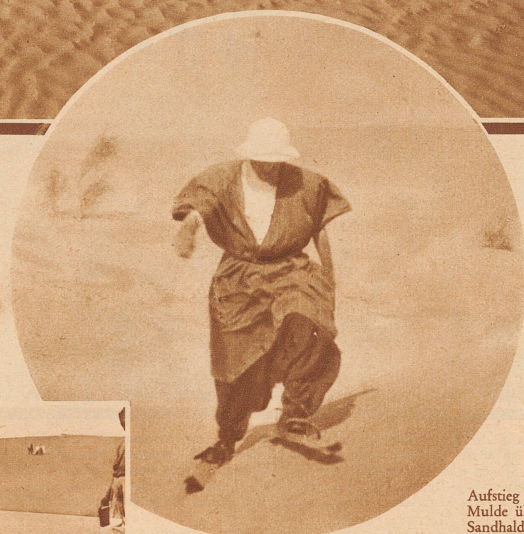
Aufstieg aus der Mulde über die Sandhalde zum Kamm. Die begleitenden Eingeborenen blieben zurück, sanken mit jedem Schritt knietief ein. Gewandt traversiert der Sandfahrer den Hang! Skiheil!

Meine wohl gelungenen Versuche in den herrlichen Frühmorgen der saharaischen Landschaft vermittelten mir sportliche Freude und den Hochgenuß, den ich einst vor Jahren auf einsamen Skiwanderungen im Pulverschnee der fernen Heimat kosten durfte.