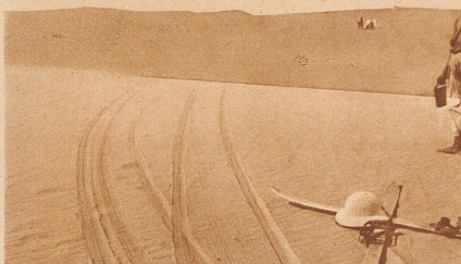
Bild links: Wer sah je eine derartige Zusammenstellung: Skier und Tropenhelme. Demselben Sportler gehörend! Zum gleichzeitigen Gebrauch! Und die Spuren? Da kennt sich das älteste Wüstenkamel nicht aus!