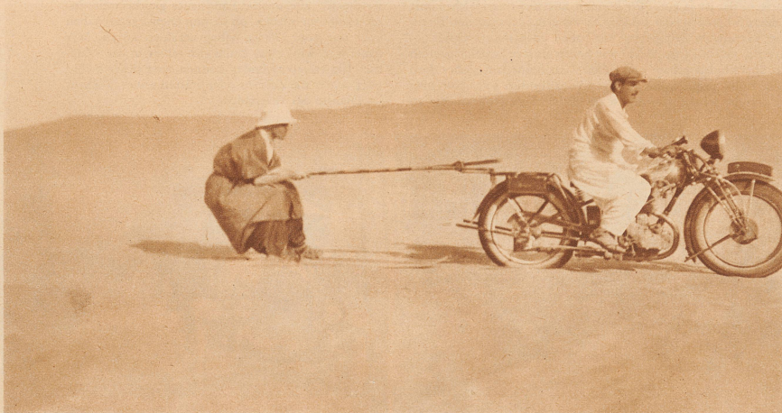
Skijöring auf Wüstensand hinter dem Motorrad. Zwei Palmenäste sind am Soziussitz festgeknottet. Dran hält sich der Sportler. Bis 50 Kilometer Stundengeschwindigkeit! Der Staub der Wüste wirbelt auf. — Vorsicht vor den steinigen Stellen oder frischem Flugsand. Der Sand brennt stark, daher die kauende Haltung. Das Training war mühsam. Stürze blieben nicht aus