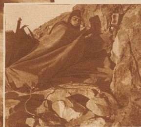
Nacht-Biwak nahe der 3000 Meter-Grenze auf dem Lenzerhorn. Auf hergerichteten Steinlagern, in die Zeltsäcke gehüllt und angeleitet, verbrachte die Hochgebirgspatrouille des Geb.-Inf.-Bat. 93 eine Manövernacht