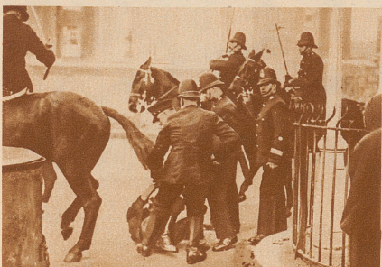
Ein Demonstrant wird von der Polizei überwältigt und verhaftet