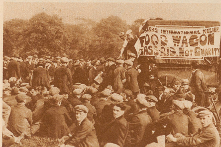
Massen-Meeting der Internationalen Arbeiterhilfe im Hyde-Park in London. In ununterbrochener Folge sprechen während des ganzen Tages Redner über die Lage und die Hilfsmöglichkeiten. Da die Zuhörer aus allen Teilen der Riesenstadt zu Fuß herbeizogen und bis spät am Abend blieben, wird in einem improvisierten Küchenwagen Suppe und Kartoffeln gekocht und gratis an die Arbeitslosen abgegeben