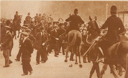
Berittene Polizei geht gegen die Teilnehmer an einer Arbeitslosen-Demonstration vor

Vor zwei Wochen schloß der britische Schatzkanzler Snowden seine große Budgetrede im Parlament mit den emphatischen Worten: «England yet will stand!» «England soll nicht untergehen!» Seither hat jeder Tag dem britischen Reich neue Sorgen und Erschütterungen gebracht: Die Auflösung des Parlaments, Demonstrationen der Arbeitslosen gegen die beabsichtigten Reduktionen der Stempelgelder, Verhaftung einzelner Demonstranten und als Folge davon neue ernste Arbeiterunruhen, die bis ins Herz der Stadt, vor das Parlament und das Mansion House drangen.