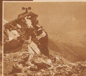
Signalmann der Hochgebirgspatrouille des Geb.-Infanterie-Bat. 93 auf dem Gipfel des Lenzerhorns