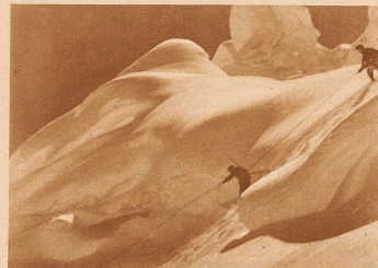
Seilabfahrt durch die Spalten hinter dem kleinen Silberhorn

Es gibt bei dieser Tages tour vom Jungfraujoch über Schnee- und Silberhorn nach der Eigergletscherstation alles, was einem wahren Bergfreund das Herz höher schlagen lassen kann. Es gibt da stiebende, harmlose Abfahrten über Jungfraupf und Guggigletscher, exponierte Felskletzerei über die Steilabstürze am Rottalsattel und an der Silberlücke, Grat traversierungen und harte Eisarbeit, verwegene Akrobatik mit dem Ski auf dem Rücken, herrliche Fernsicht auf den Gipfeln vom Schnee- und Silberhorn. Diese Tour ist ein Erlebnis, eine Kette von Eindrücken, die nie verblassen werden.