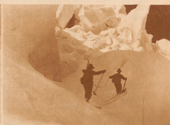
Queren einer Spalte in den Eindrücken des Kühnauengletschers