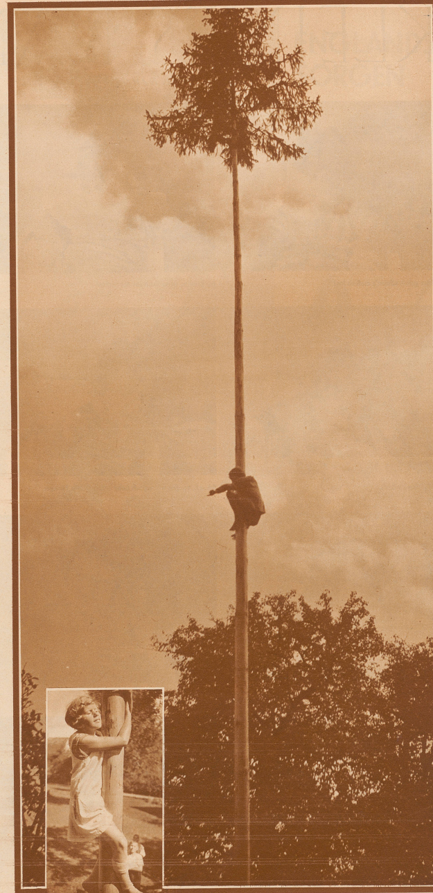
Am Kletterbaum. Zwei Bilder von einem Kinderfest im Schaffhauser