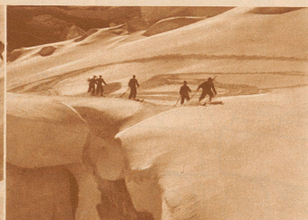
Vorsichtige Fahrt am gestrafften Seil über den Guggigletscher