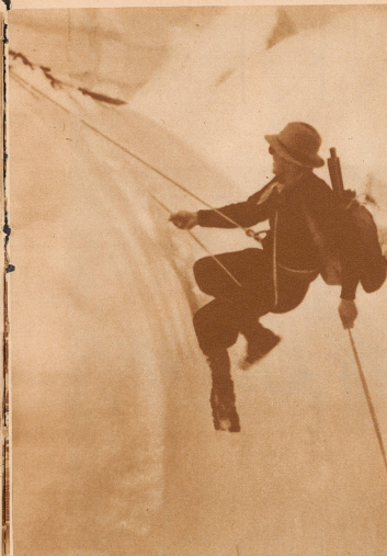
Traversieren einer Spalte und Absilen zum Firn bei der Silberlücke

Trainierte Körper, letztes Können, vollendete Technik, ski- wie bergsportlich, sind die ersten Voraussetzungen für das Gelingen einer so schwierigen Tour mit den Brettern. Jede Lage muß völlig beherrscht werden.