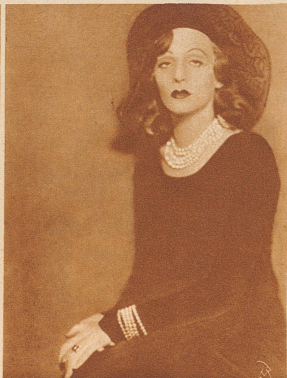
Eine Landsmännin und fast Doppelgängerin Greta Garbos, die Max Reinhardt im Vasa-Theater in Stockholm entdeckt und für zwei deutsche Tonfilme engagiert hat: Zarah Leander