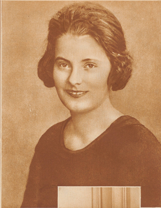
Vor zehn Jahren: die sechzehnjährige Greta Garbo, die als kleine Verkäuferin eines schwedischen Modenhauses ihre Karriere begann