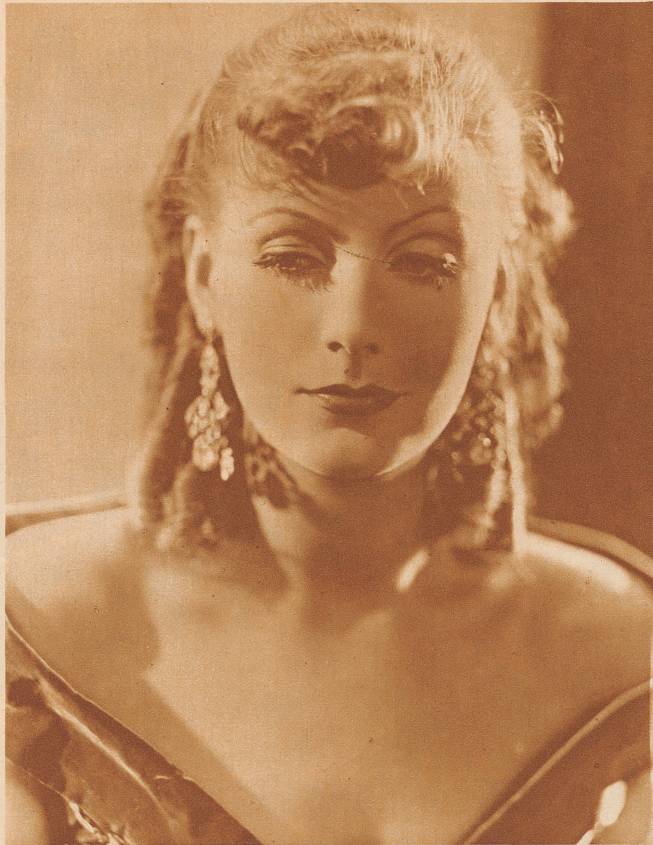
Die Gegenwart: Greta Garbo im Film «Romanze»