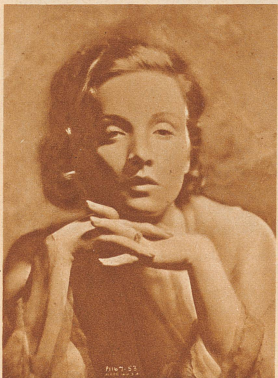
Lange kann man raten: «Ist es Garbo? Wenn nicht — wer ist es?» Es ist die größte Garbo-Trabantin: Marlene Dietrich