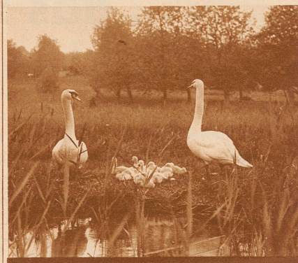
SCHWÄNE AM HALLWILER SEE

Wie diese Schwäne ihre Brut beschützen, so wachen kundige Hände über die Herstellung einer stets guten Qualität der bekannten Hallwiler Forellen