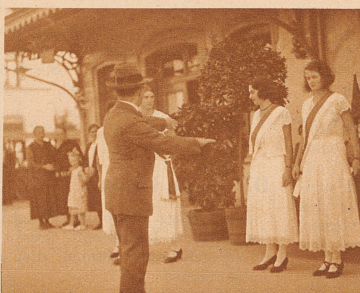
Letzte Anordnungen zum Empfang: «Meine lieben Ehrenjungfern, der Platz vor dem Tischchen muß für die Meisterschützen frei bleiben!»