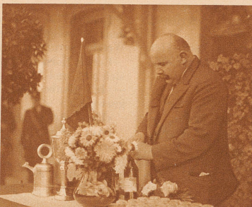
Einen währschaffen Schluck alten «Bernecker», damit die Schützen wissen, daß sie wieder in der Heimat sind. Der Wirt vom Bahnhof-Restaurant öffnet eigenhändig die Flaschen