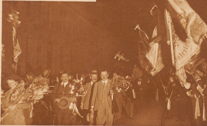
Bild rechts: In Zürich steigen die Matchschützen endlich aus. Man empfängt sie mit Begeisterung. Die Fahnen aller städtischen Schützenvereine flattern und unter Musikklangen geht's im Umzuge durch die Stadt