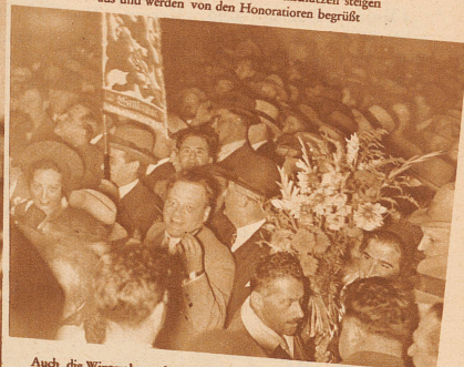
Auch die Winterthurer haben keine Ruhe, bevor die Matchschützen aussteigen und sich ins Gedränge mischen