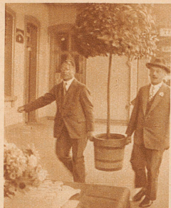
St. Margrethen darf die siegreichen Schützen zuerst auf Schweizerboden willkommen heißen. Der Rheintalische Bezirkschützenverband hat die Begrüßung übernommen. Ein Tischchen, die Schweizerfahne darüber, gute Tinkame, Blumen, das ganze links und rechts von Bäumchen umrahmt — der Zug mit den Schützen kann ruhig kommen