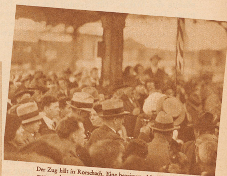
Der Zug hält in Rorschach. Eine begeisterte Menschenmenge schwenkt die Hüte. Die Matchschützen steigen aus und werden von den Honoratioren begrüßt