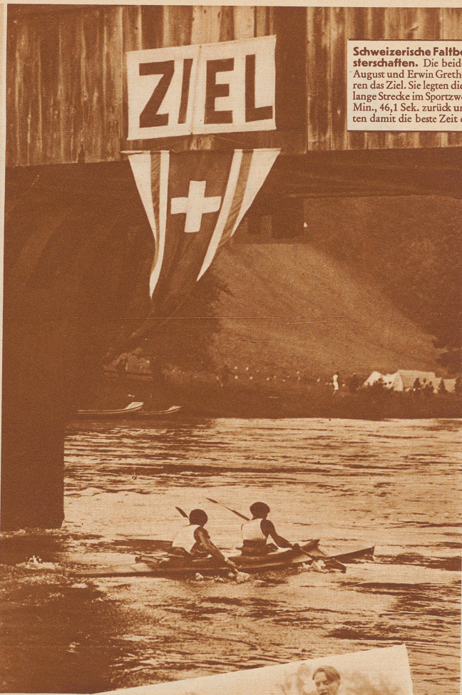
Schweizerische Faltbootmeisterschaften. Die beiden Basler August und Erwin Grether passieren das Ziel. Sie legten die 13,4 km lange Strecke im Sportweier in 45 Min., 46,1 Sek. zurück und erzielten damit die beste Zeit des Tages