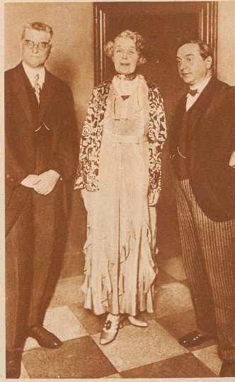
Ricarda Huch, die größte Dichterin der Jetztzeit, erhielt als erste Frau den Goethepreis der Stadt Frankfurt, der vor ihr dem Philosophen Leopold Ziegler, Sigmund Freud, Albert Schweitzer und Stefan George verliehen worden war. Ricarda Huch hat in Zürich studiert und war als Lehrerin an der Höheren Töchtertschule tätig

Die «Zürcher Illustrierte» erscheint Freitags • Schweizer Abonnementspreise: Vierteljährlich Fr. 3.40, halbjährlich Fr. 6.40, jährlich Fr. 12.—. Bei der Post 30 Cts. mehr. Postscheck-Konto für Abonnements: Zürich VIII 3790 • Auslands-Abonnementspreise: Beim Versand als Drucksache: Vierteljährlich Fr. 4.50 bzw. Fr. 5.25, halbjährlich Fr. 8.65 bzw. Fr. 10.20, jährlich Fr. 16.70 bzw. Fr. 19.80. In den Ländern des Weltpostvereins bei Bestellung am Postschalter etwas billiger. Insertionspreise: Die einspaltige Millimeterzeile Fr. —.60, fürs Ausland Fr. —.75; bei Platzvorschrift Fr. —.75, fürs Ausland Fr. 1.—. Schluß der Inseraten-Annahme: 14 Tage vor Erscheinen. Postscheck-Konto für Inserate: Zürich VIII 15769