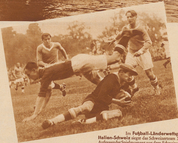
Im Fußball-Länderwettspiel Italien-Schweiz siegte das Schweizerteam 3:1. Aufregender Spielmoment vor dem Schweizerort