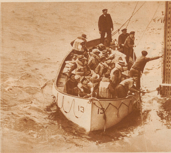
Das Hapag-Motorschiff «General Osorio» rettet 88 Schiffbrüchige des bei Cap Boi infolge unsichtigem Wetter gestrandeten amerikanischen Dampfers «WesternWorld». Ein Teil der Schiffbrüchigen wird vom Rettungsboot an Bord des «General Osorio» genommen