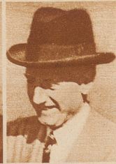
Sir Hoare, Staatssekretär für Indien (Konservativ)