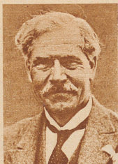
Ramsay Mac Donald, Premierminister (Labour Party)