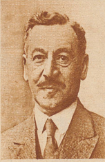
Sir Herbert Samuel, Innenminister (Liberal)