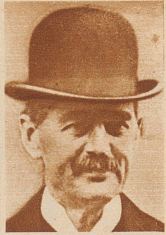
Sir John Austus Chamberlain, Gesundheitsminister (Konservativ)