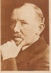
James Henri Thomas, Kolonial- minister (Labour Party)