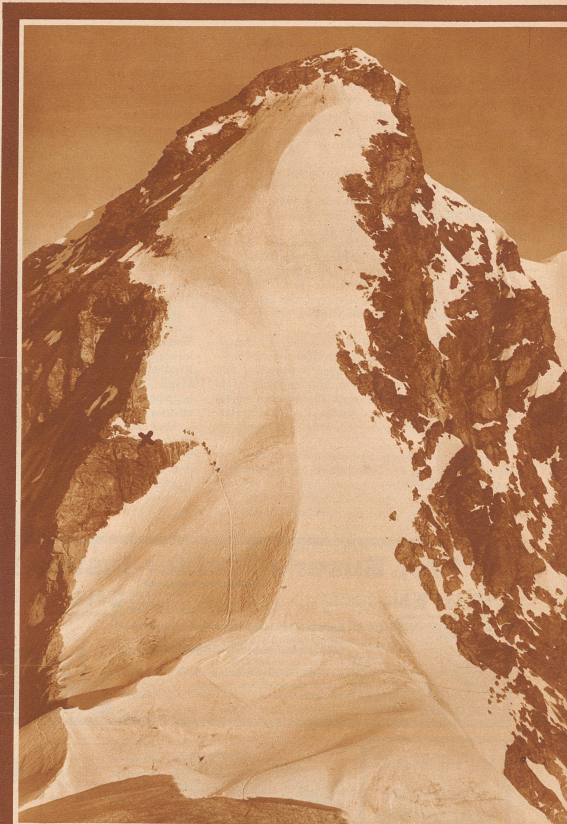
Am berühmten Rottalattel sind drei englische Touristen beim Abstieg vom Gipfel der Jungfrau im Kanton Bern. Die drei Verunglückten gehörten einer Gruppe von Studenten an, die gemeinschaftlich mit dem durch seine Everest-Finsh-Touren im Jungfraugebiet ausführenden. Der Absturz erfolgte beim Traversieren einer Eissrinne über hohe Wand auf ein Eisfeld oberhalb der Rottalattlücke, wo die Leichen mehrere Tage liegen blieben ehe Unser Bild zeigt die Abtaststelle vom Rottalattel gesehen