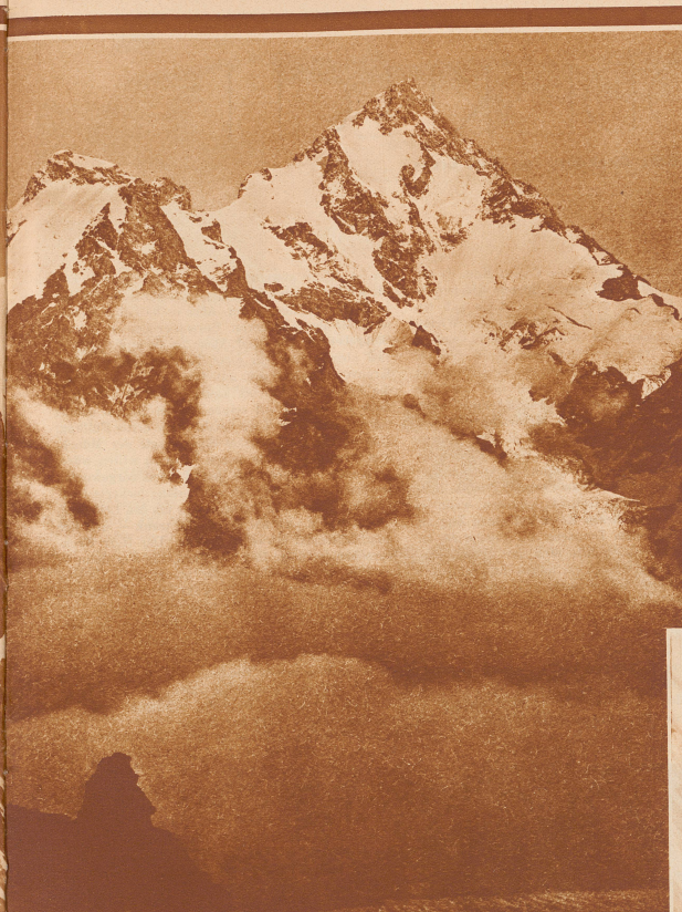
abgestürzt. Die drei Verunglückten gehörten einer Gruppe von Studenten an, die gemeinschaftlich mit dem durch seine Everest-Finsh-Touren im Jungfraugebiet ausführenden. Der Absturz erfolgte beim Traversieren einer Eissrinne über hohe Wand auf ein Eisfeld oberhalb der Rottalattlücke, wo die Leichen mehrere Tage liegen blieben ehe Unser Bild zeigt die Abtaststelle vom Rottalattel gesehen