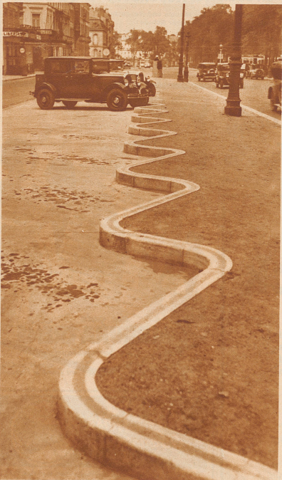
Dies ist nicht etwa eine neue Seeschlange, sondern nur der Einfall eines Straßenbauers, der diese Gestaltung eines Parkplatzes zur Nachahmung empfiehlt, weil sie die Fahrer zwingt, jeden Wagen schön neben seinen Nachbarn zu setzen