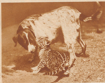
Junger Jaguar spielt mit seiner Ziehmutter, einer Hündin