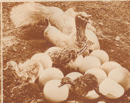
Eine Straußenmutter ist mitten aus der Arbeit des Brutgeschäftes heraus gestorben. Eine Truthe brütet die Eier ganz aus und wird den jungen Straußen eine liebevolle Stiefmutter