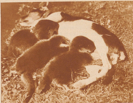
In Pommern wurde an einem Mühlenteich ein Wurf junger Fischotter gefunden; die wunderschönen Tierchen konnten mit einer Foxterrierhündin großgezogen werden. Es war eigenartig, daß es einige Wochen dauerte, bis die jungen Fischotter in ihr eigenstes Element, das Wasser, hineingingen