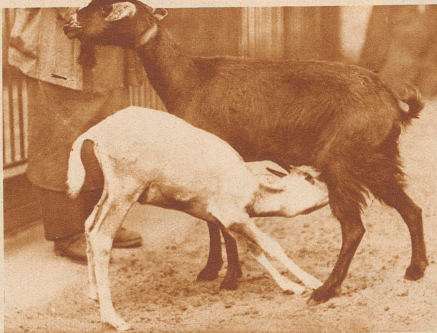
Junge Säbelantilope aus Marokko mit ihrer Amme, einer Beduinenziege