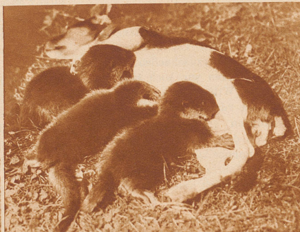
In Pommern wurde an einem Mühlenteich ein Wurf junger Fischotter gefunden; die wunderschönen Tierchen konnten mit einer Foxterrierhündin großgezogen werden. Es war eigenartig, daß es einige Wochen dauerte, bis die jungen Fischotter in ihr eigenstes Element, das Wasser, hineingingen