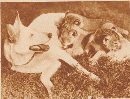
Weißer deutsche Schäferhündin als Amme von drei jungen Löwen