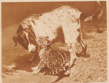
Junger Jaguar spielt mit seiner Ziehmutter, einer Hündin