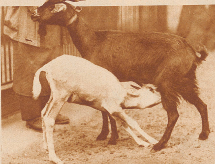
Junge Säbelantilope aus Marokko mit ihrer Amme, einer Beduinenziege