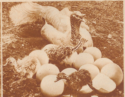
Eine Straußenmutter ist mitten aus der Arbeit des Bruggeschäftes heraus gestorben. Eine Truthe brütet die Eier ganz aus und wird den jungen Straußen eine liebevolle Stiefmutter