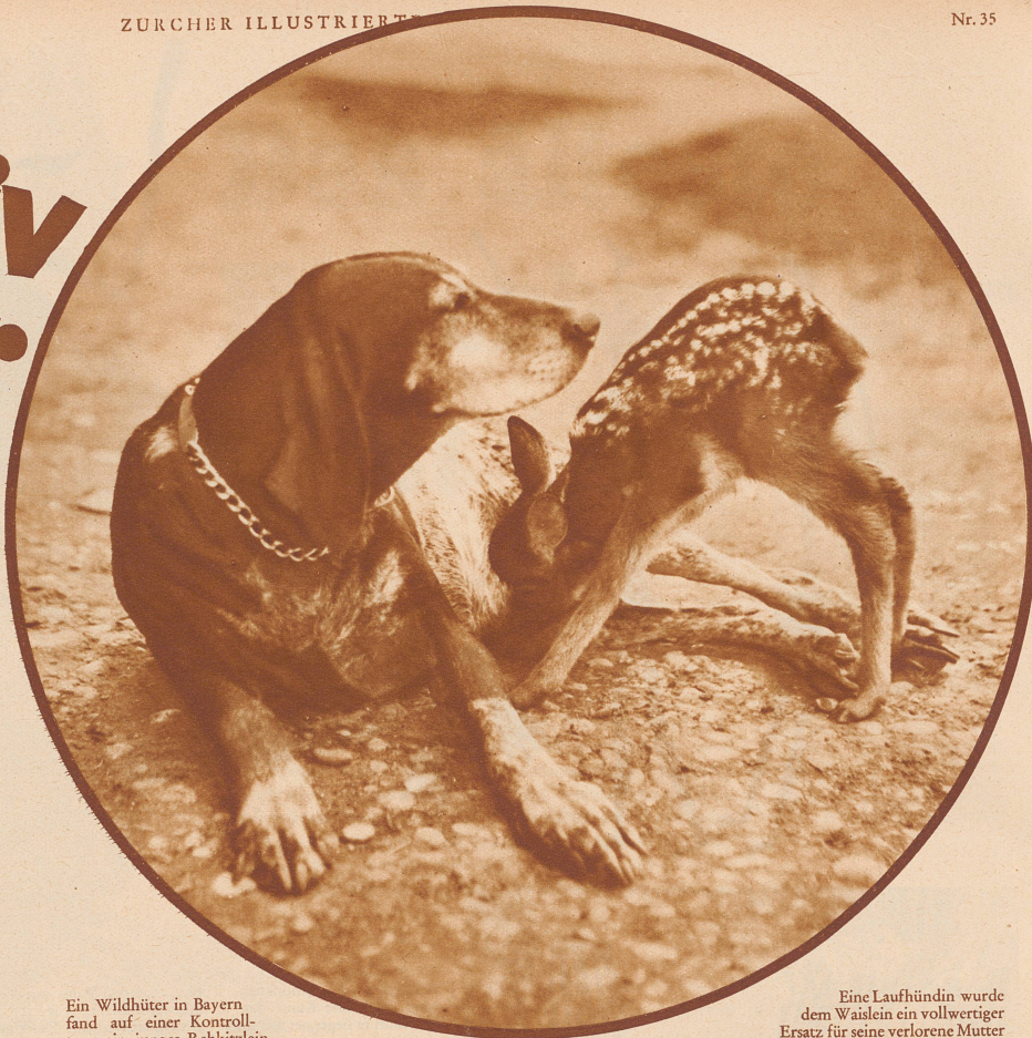
Ein Wildhüter in Bayern fand auf einer Kontrolltour ein junges Rehkitzlein.

Stiefmütter, Adoptivkinder, das gibt es auch in der Tierwelt. Sie beide sind nicht nur Gegenstand ältester Sagen und Märchen, weiser Aussprüche und feinstgeformter Fabeln, sondern in unserer Zeit auch Objekt ernster biologischer Forschungen geworden. Sie sind Symbolik und nüchterne Sachlichkeit, je nachdem wir uns zu ihnen einstellen und je nachdem wir sie in das Blickfeld unserer Interessen rücken. Es soll nicht die Rede sein von Muttertieren, die verwaiste Säuglinge ihrer eigenen Art annehmen und sie hochziehen, denn das ist ja eigentlich noch verständlich. Es sind jedoch heute unzählige Fälle bekannt, daß Tierammen bei anderen Arten die Mütter ersetzen und das fremde, unmündige Kind annehmen, säugten, ihm Schutz gewährten, ihm die Technik des Jagens beibrachten, es erzogen wie die eigenen Sprößlinge. Solche fürsorgliche Mutterliebe zu dem unbekannten Jungen ist ein bewundernswertes Rätsel.