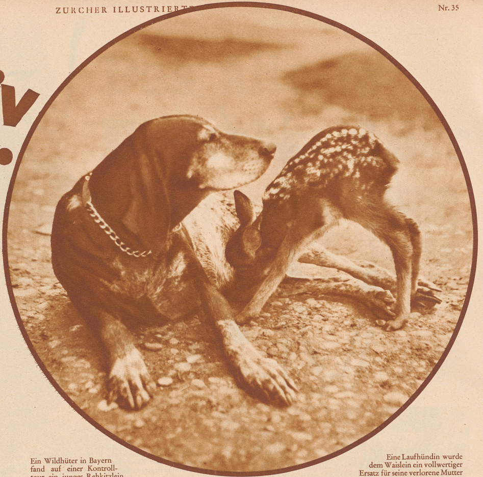
Ein Wildhüter in Bayern fand auf einer Kontrolltour ein junges Rehkitzlein.

Stiefmütter, Adoptivkinder, das gibt es auch in der Tierwelt. Sie beide sind nicht nur Gegenstand ältester Sagen und Märchen, weiser Aussprüche und feinstgeformter Fabeln, sondern in unserer Zeit auch Objekt ernster biologischer Forschungen geworden. Sie sind Symbolik und nüchterne Sachlichkeit, je nachdem wir uns zu ihnen einstellen und je nachdem wir sie in das Blickfeld unserer Interessen rücken. Es soll nicht die Rede sein von Muttertieren, die verwaiste Säuglinge ihrer eigenen Art annehmen und sie hochziehen, denn das ist ja eigentlich noch verständlich. Es sind jedoch heute unzählige Fälle bekannt, daß Tierammen bei anderen Arten die Mütter ersetzen und das fremde, unmündige Kind annehmen, säugten, ihm Schutz gewährten, ihm die Technik des Jagens beibrachten, es erzogen wie die eigenen Sprößlinge. Solche fürsorgliche Mutterliebe zu dem unbekanntem Jungen ist ein bewundernswertes Rätsel.