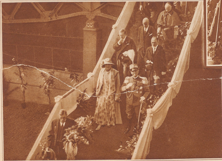
Der König und die Königin von Italien, die dem Stapellauf des «Rex» beigewohnt hatten, verlassen die Werft von Sestri

dem «Augustus» angewandt und wodurch diese absolut vibrationsfrei gemacht wurden und die größtmögliche Stabilität auch bei bewegter See erhielten. Die Maschinen sind im mittleren Teil des Schiffsrumpfes untergebracht, und dieser ist auf seiner ganzen Länge durch eine doppelte Wand geschützt. Der Dampfer verfügt über eine genügende Anzahl abgedichteter Schotten, sowie über jegliche neuzeitliche Sicherung, welche den von den italienischen und fremden Gesetzen diesbezüglich vorgesehenen Bestimmungen in jeder Beziehung entsprechen. Die verschiedenen Teile der Schiffsmaschinen werden in separaten, abgedichteten Räumen untergebracht, so daß die Arbeit von mindestens der Hälfte der Turbinen und aller anderen Einrichtungen des Schiffes gesichert bleibt, falls demselben eine große Havarie irgendwelcher Art zustoßen sollte. Die Schiffsmaschinen bestehen aus vier von einander unabhängigen Gruppen von Hochdruckturbinen, von denen jede je eine der gigantischen Schiffsschrauben bedient. Die Turbinen werden von 14 Kesseln gespeist, und die entwickelte Kraft wird genügen, um dem Schiffe eine Geschwindigkeit von über 27 Knoten (mehr als 50 km) pro Stunde zu verleihen, so daß die Ueberfahrt Italien-New York in sieben Tagen bewerkstelligt werden kann. Außer des mit raffinierter Eleganz ausgestatteten Speisesalons, der reichen Bibliothek, den Rauchsals, verfügt der «Rex» über geräumige, geschlossene Veranden, große, offene Promenaden für alle Klassen, über