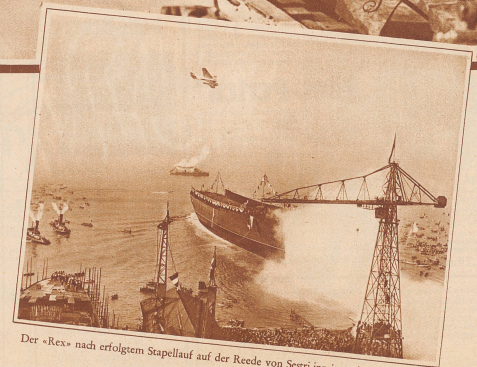
Der «Rex» nach erfolgtem Stapellauf auf der Reede von Sestri inmitten festlicher Boote

wird 100 Tonnen wiegen. Die Schrauben haben einen Durchmesser von 5 Meter, die Böden der Salons, Hallen, Kabinen und Veranden haben den gewaltigen Flächeninhalt von 40000 m 2 . * So wird nun bald der «Rex» von der «Navigazione Generale Italiana» durch die Wogen über den weiten Ozean gleiten, als würdiger Repräsentant von kühnem Unternehmungsgest, intensiver Aufbauarbeit und großem technischen Können des neuen Italien.