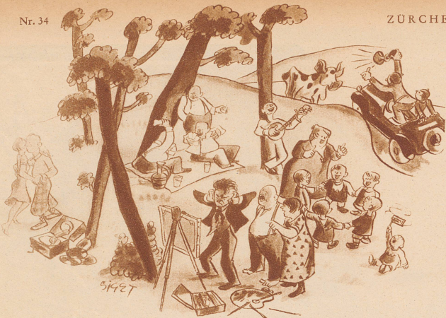
Die Ruhe, welche die Mitwelt dem schaffenden Künstler gönnt