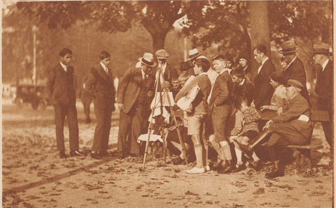
«So ein Gedränge möchte ich einmal sehen, wenn ich meine Bilder zum Verkauf anbiete», denkt die Malerin

So ein Maler kann sich also auch was denken über die Leute die ihn stören. Aufgepaßt, nicht die Kinderwagen hinstellen, damit die Kinder was zu gucken haben! Nicht ihm fast auf die Füße treten! Nicht den Rauch der Brissago ihm ins Gesicht blasen! Schont den Arbeitenden! Rücksicht ziert den Zuschauer! Maler sind Schöpfer, sie haben Nerven, schont sie! Platz dem Maler! k.