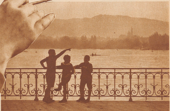
Die Landschaft, um die sich's handelt. Duftige Farben sind schwer zu treffen. Die Buben vorn könnten ebensogut anderswo spielen, aber sie fühlen sich offenbar im Bildfeld ganz besonders wohl