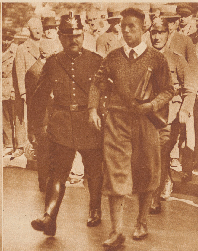
Die Verhaftung demonstrierender Nationalsozialisten bei der Ankunft des britischen Außenministers Henderson in Berlin

ZU DEN UNRUHEN UND DEMONSTRATIONEN IN BERLIN