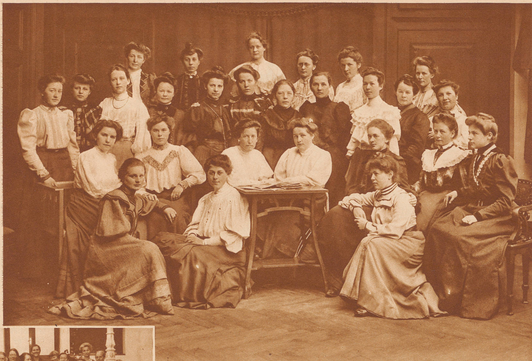
Früher alt — jetzt jung