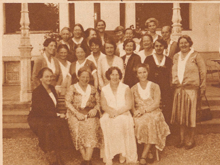
... und nach 25 Jahren

Welter irgend etwas nicht stimmt, steht für ihn fest. Wenn er sich nur ein einwandfreies Bild über die Beziehungen zwischen Nora und ihm machen könnte. Man sprach ja damals von einer Liebschaft, aber das konnte ebensogut Theater- und Kurhausklatsch sein. Nora selbst zu befragen, hat er bisher vermieden. Wozu auch! Welche Frau gibt so etwas unumwunden zu? Und darauf kam es auch gar nicht an. Nur darauf, ob Welters Neigung zu ihr noch immer so stark, so leidenschaftlich war, daß sie als Motiv zu dem Mord an Detring angesehen werden könnte.