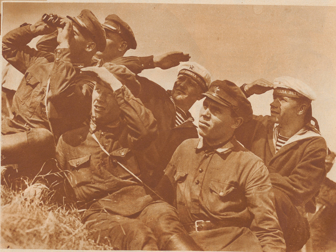
Bild rechts: Rotarmisten und Marinesoldaten beobachten den Rundflug des «Graf Zeppelin» über Leningrad

Die «Zürcher Illustrierte» erscheint Freitags • Schweizer Abonnementspreise: Vierteljährlich Fr. 3.40, halbjährlich Fr. 6.40, jährlich Fr. 12.-. Bei der Post 30 Cts. mehr. Postscheck-Konto für Abonnements: Zürich VIII 3790 • Auslands-Abonnementspreise: Beim Versand als Drucksache: Vierteljährlich Fr. 4.50 bzw. Fr. 5.25, halbjährlich Fr. 8.65 bzw. Fr. 10.20, jährlich Fr. 16.70 bzw. Fr. 19.80. In den Ländern des Weltpostvereins bei Bestellung am Postschalter etwas billiger. Insertionspreise: Die einspaltige Millimeterzeile Fr. -.60, fürs Ausland Fr. -.75; bei Platzvorschrift Fr. -.75, fürs Ausland Fr. 1.-. Schluß der Inseraten-Aannahme: 14 Tage vor Erscheinen. Postscheck-Konto für Inserate: Zürich VIII 1576/