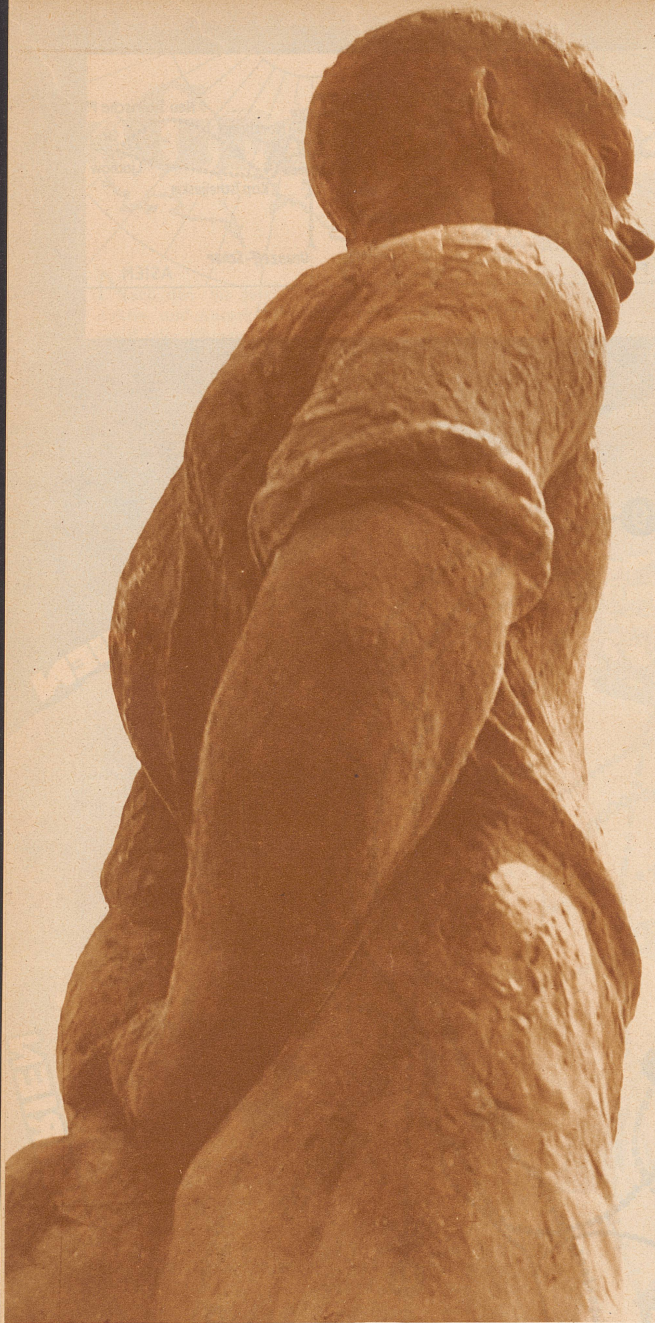
Von eindringlicher Wucht ist der «Arbeiter» des Karlsruher Künstlers Christoph Voll; die Statue hat am Utoquai Aufstellung gefunden