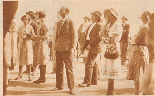
Die Statuen werden mit größtem Interesse besichtigt. Wenn einzelne gelegentlich auch scharfer Kritik unterzogen werden, so ist man sich doch darüber einig, daß das Stadtbild durch die Ausstellung von Plastiken im Freien gewonnen hat