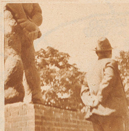
Wie oft kann man beobachten, daß Beschauer sich in eindringliche Plastiken so hineinversetzen, daß sie unwillkürlich die Haltung des Dargestellten einnehmen