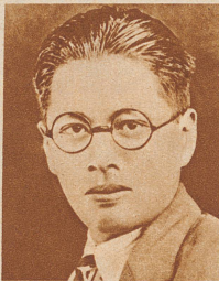
Attentat auf den chinesischen Finanzminister. Als der chinesische Finanzminister T. V. Sung den Bahnhof von Shanghai verließ, wurde auf ihn ein Bombenattentat verübt. Sung wurde nur unerheblich verletzt, die Attentäter verhaftet