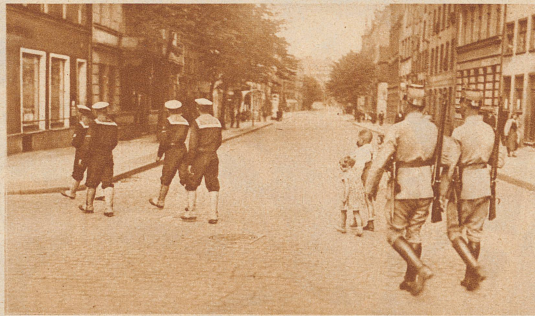
Im Freistaat Danzig dürfen die polnischen Matrosen nicht mehr allein durch die Straßen gehen. Um Reibereien zwischen der Bevölkerung und den Polen zu verhindern, werden sie von Beamten der Danziger Schutzpolizei begleitet