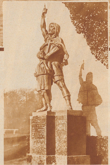
Ein Wilhelm Tell in Südamerika. Anlässlich der Jahrhundertfeier der Schweizer Kolonie in Montevideo wurde in dieser Stadt ein Telledenkmal enthüllt. Es ist ein Werk des heute in Uruguay tätigen Tessiner Bildhauers Belloni