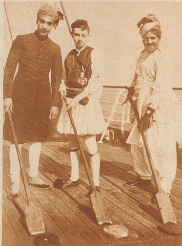
Weltkonferenz des Christlichen Vereins junger Männer in Cleveland (U. S. A.): Drei Teilnehmer, zwei Inder und ein Grieche, während der Ueberfahrt nach Amerika beim «Shuffle-board-Spiel» auf dem Deck des Dampfers