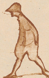
Karikatur von Walter Plattner (Winter 1921/22 in Bümpfiz)

eintrugen. Oder vielleicht sah er in seinem Freunde Loosli noch immer den geplagten Anstaltsbuben durchschimmern, dessen Gerechtigkeitsgefühl noch immer aufbrandete und erst Erlösung fand in den Kampfschriften «Anstaltsleben», «Ich schweige nicht» und «Erziehen, nicht erwürgen!»