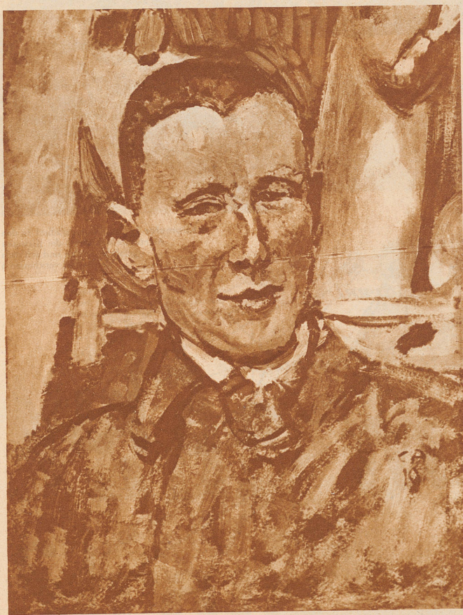
So malte ihn Dr. Cuno Amiet im Sommer 1919 auf der Ostwand. Das Bild gehört zu jenen Werken Amiets, die nicht ein Opfer der Flammen wurden