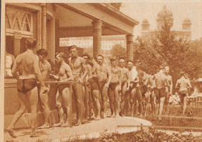
Kilometer 0: Der Eintritt ist frei, und im demokratischsten Kleidungsstück, der Badehose, erhebt sich der Berner. Steigt er aus dem kühlen Aarewasser, so genehmigt er sich gerne im «Alkoholfreien» ein Glas Milch oder Süßmost, einen Teller warme Suppe und ein gewaltiges Stück Brot.