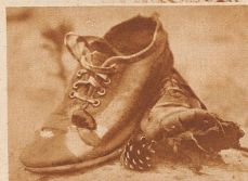
Kilometer 2: Wer die Einsamkeit liebt, flieht die Stadt und ruht hier in der Stille der Natur aus. Ab und zu kann es aber einem zerstreuten Professor passieren, daß er seine Sonntagschuhe liegen läßt – ob er sie auf dem Fundbüro wieder findet?