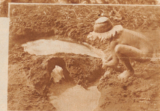
Kilometer 3: Das Kinderparadies! In den Aareteümpeln können die Kleinsten gefahrlos spielen und sich nach Herzenslust verschmieren.