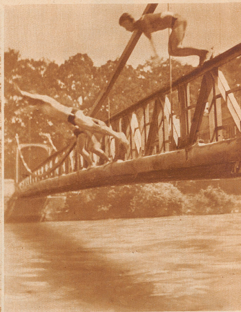
Bild rechts: Kilometer 5: Mit Kinderwagen, Grammophon und Schwimmgürtel bewaffnet kommen Sonntags die Familien scharenweise anspaziert. Am Werktag geht's ruhiger zu, und nur ein paar Buben plätschen im Wasser.