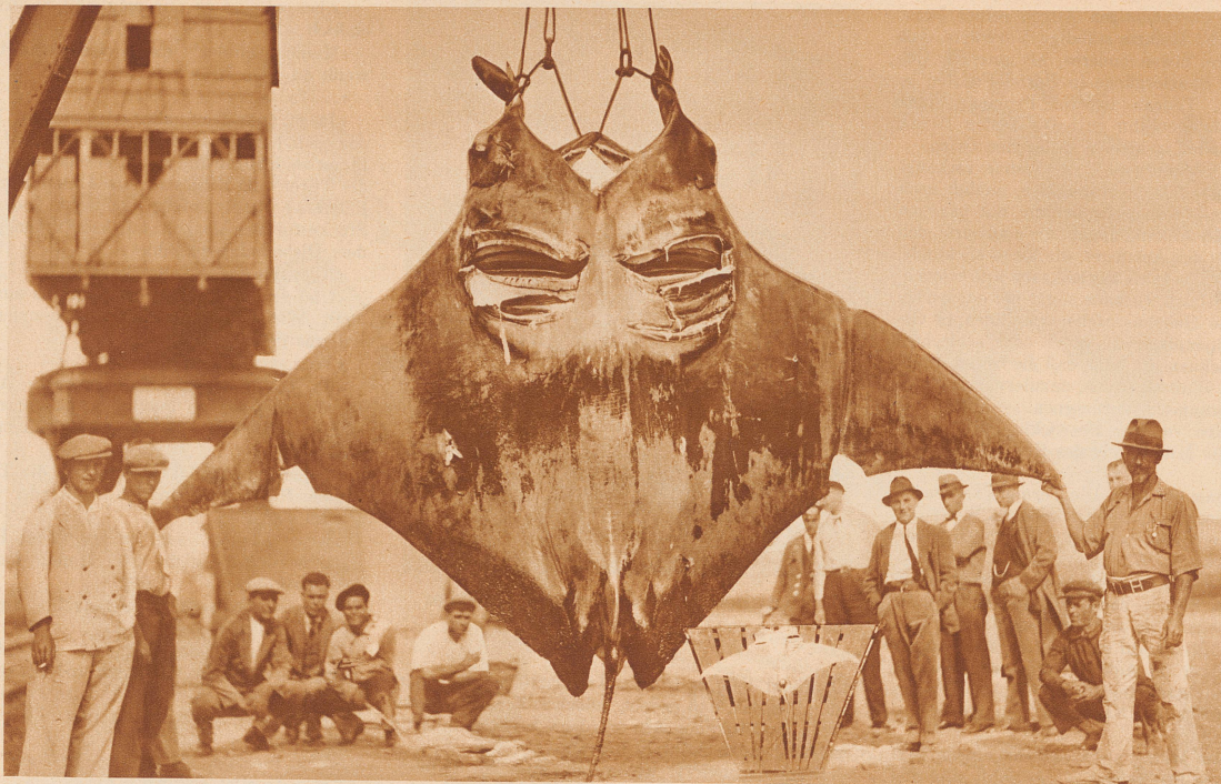
Der tote Seeteufel nach der Bergung. Auf dem Rost ausgespannt das im Todeskampf geworfene Junge