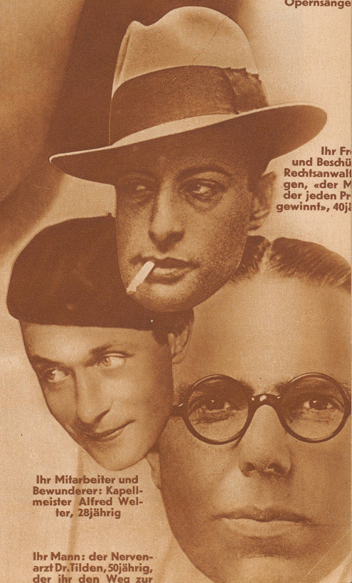
Ihr Fr und Beschü Rechtsanwalt gen, «der M der jeden Pr gewinnt», 40j