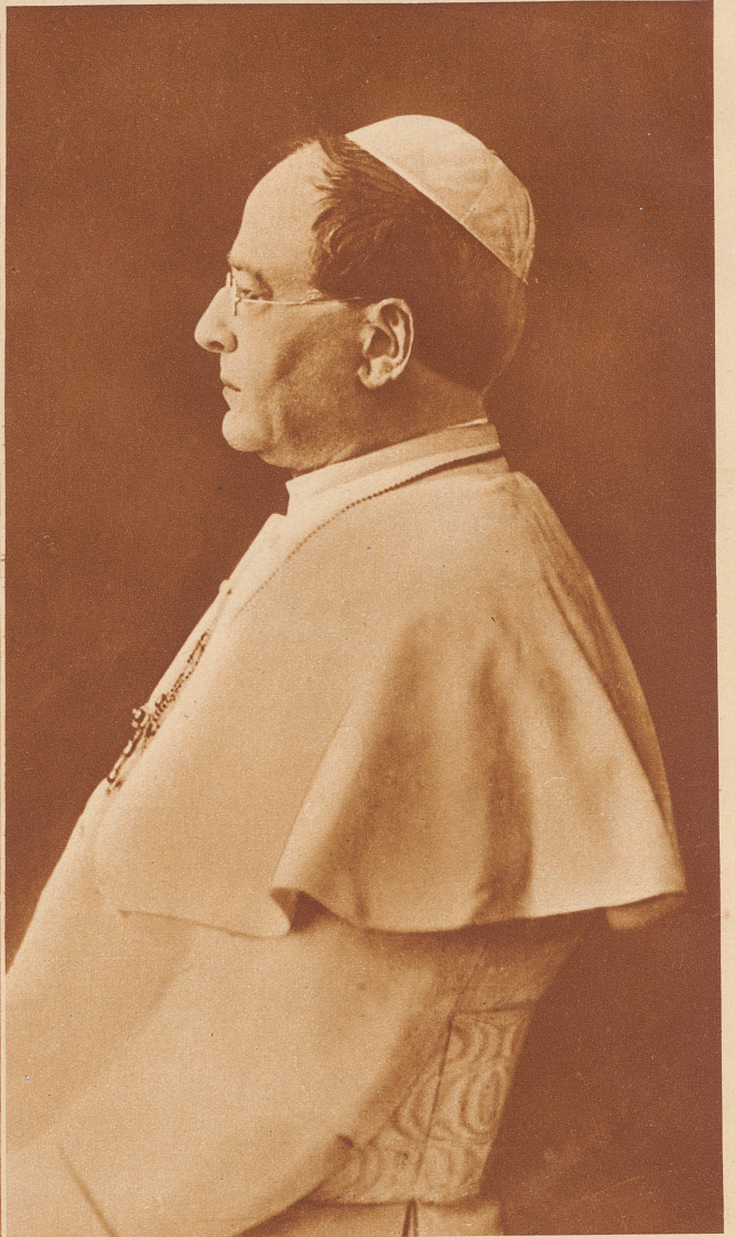
Papst Pius XI.

Es sind etwas mehr als zwei Jahre her, daß der Kirchenstaat wieder hergestellt worden ist und «auf ewige Zeiten» Frieden zwischen dem Heiligen Stuhl und dem Königreich Italien geschlossen wurde. Aber dieser Friede war nicht von langer Dauer. Schon nach einem Jahr entstanden Reibereien zwischen dem Vatikan und Mussolini, die nie mehr ganz aufhörten. In den letzten Tagen hat der Konflikt sich verschärft und man kann gespannt sein, was für ein Ende dieser Streit finden wird.