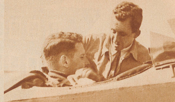
Der Kunstflieger Gardon, der durch seine Akrobatik und kühnen Rückenflüge die riesige Zuschauermenge verblüffte