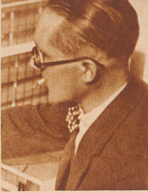
dem Architekt Le Corbusier

aus Riva San Vitale. Namhafter Komponist und Direktor der beiden bedeutendsten Harmoniemusiken der Schweiz, der Stadtmusik Zürich und Schaffhausen