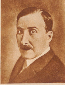
dem Oesterreicher Stefan Zweig,

der aus der Malerfamilie Le Jeanneret aus La Chaux-de-Fonds stammt und seit 20 Jahren in Paris lebt; er ist einer der Führer und schöpferischen Köpfe der Bewegung des «Neuen Bauens», die sich trotz mancherlei Widerständen in den letzten Jahren immer stärker durchgesetzt hat. Le Corbusier hat den Auftrag bekommen, in der «Cité Universitaire» in Paris das Haus der Schweizer Studenten zu bauen