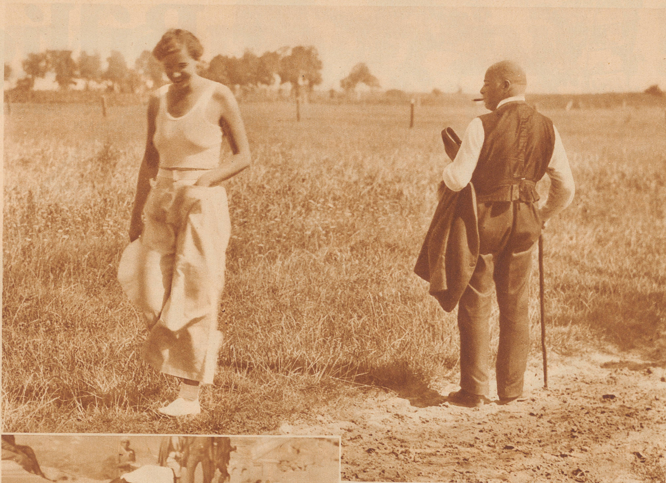
Begegnung im Felde