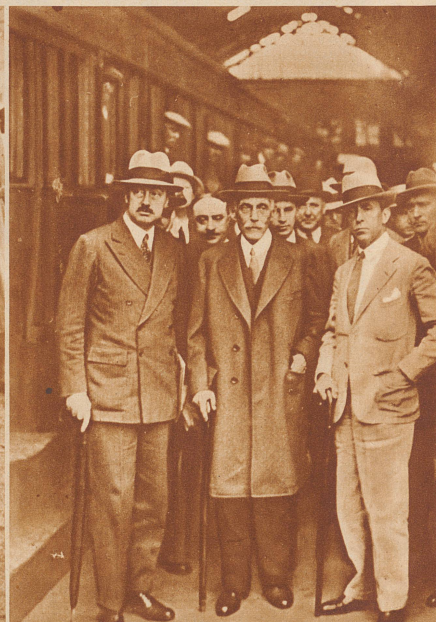
Zu den französisch-amerikanischen Verhandlungen über den Hoovervorschlag in Paris hat Amerika den Staatssekretär Mellon beordert. Bild: Mellon bei seiner Ankunft in Paris