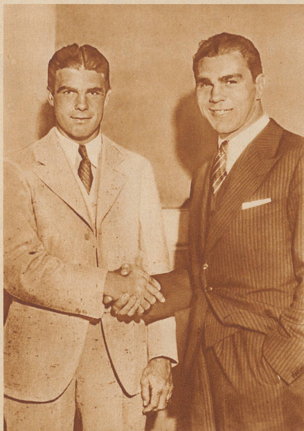
Bei dem Boxwettkampf um die Weltmeisterschaft im Schwergewicht, die vergangenen Freitag vor 35 000 Zuschauern in Cleveland ausgetragen wurde, siegte in der 15. Runde der Deutsche Max Schmeling über den Amerikaner Young Stribling. Unser Bild zeigt die beiden Rivalen unmittelbar vor dem Kampfe