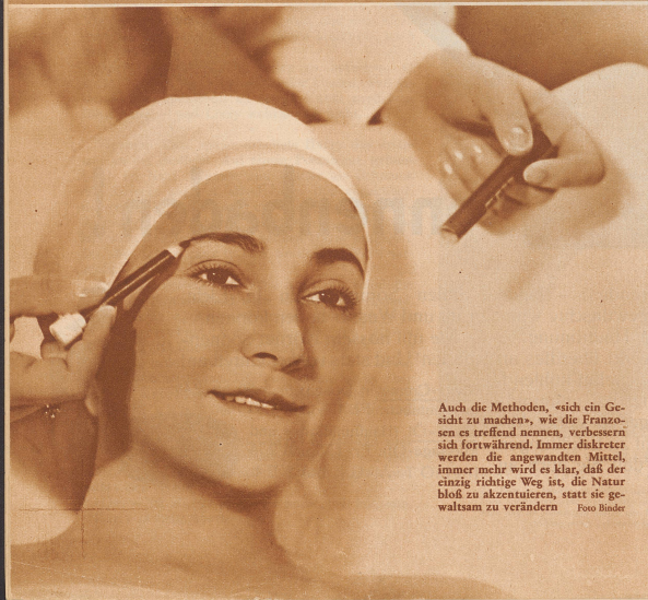
Auch die Methoden, «sich ein Gesicht zu machen», wie die Franzosen es treffend nennen, verbessern sich fortwährend. Immer diskreter werden die angewandten Mittel, immer mehr wird es klar, daß der einzig richtige Weg ist, die Natur bloß zu akzentuieren, statt sie gewaltsam zu verändern.