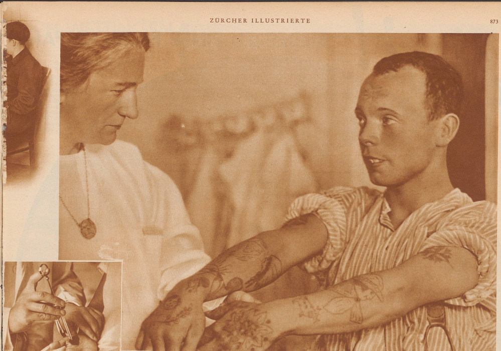
Bild links: Früher wurde solch ein kleines Mädchen die entstehenden Flecke auf seiner Hand nie mehr los, denn kein Arzt beschäftigte sich damit. Jetzt nimmt Mutter sie mit in die Beratungsstelle, ein kleiner Eingriff, — und sie ist von allem späterem Kummer bewahrt