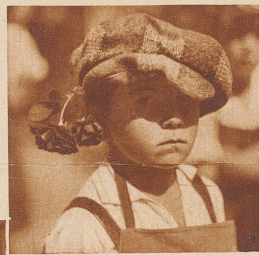
Bild unten: Am Kinder-Blumenkors der Rosenkönigin nahm eine mächtige Seerose teil, deren lebendige Füllung die Zuschauer entzückte

Bild rechts: Am Weggiser Rosenfest trägt jedermann eine Rose: im Knopfloch, in den Händen, im Haar usw. Dieser Festzugsteilnehmer hat sich die Rose als Gegengewicht an die schiefe Mütze gehängt