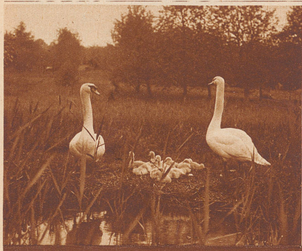
SCHWANE AM HALLWILER SEE

GENERALDEPOT: DOETSCH, GRETHNER & CO., A.-G., BASEL