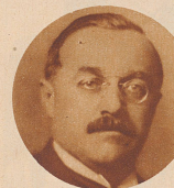
Dr. Karl Buresch, der neue österreichische Bundeskanzler. Nachdem er Dr. Seipel nicht gelungen ist ein Kabinett zu bilden, wurde der bisherige Landeshaupmann von Niederösterreich, Dr. Karl Buresch, zum Bundeskanzler ernannt. Er gehört der christlichsozialen Partei an