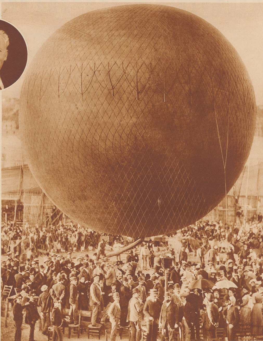
Bild rechts: Im Jahre 1891 gelang Spelterini ein mehrstündiger Flug über den Vesuv. Das Bild zeigt uns seinen Ballon kurz vor dem Start in Neapel, und gibt uns gleichzeitig einen Begriff von der Mode jener Zeit. Diese seltene Foto wurde der «Zürcher Illustrierten» von Herr Oberstleutnant Sant-schi freundlich zur Verfügung gestellt

Bild unten: Teilansicht der Stadt Johannesburg in Transvaal, eine Aufnahme Spelterinis aus den Neunziger Jahren. Ein Bild der zweckbetonten Anlage dieser Stadt, das wir heute schon gewohnt sind, das aber damals, als es entstand, durchaus neu wirkte. Wehrli-Verlag