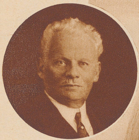
Kapitän Spelterini zur Zeit seines letzten Aufstieges im Jahre 1926