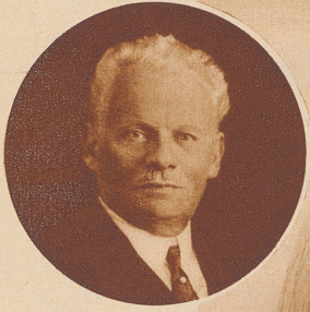
Kapitän Spelterini zur Zeit seines letzten Aufstieges im Jahre 1926