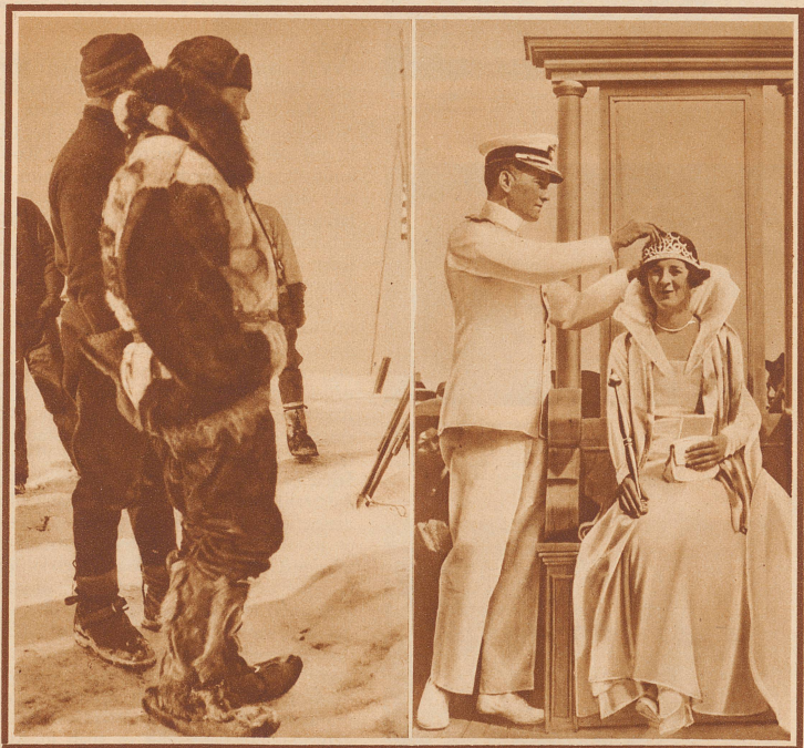
Byrd vor 2 Jahren: in der Eiswüste der Antarktis gefährdet und zu großen Taten entschlossen