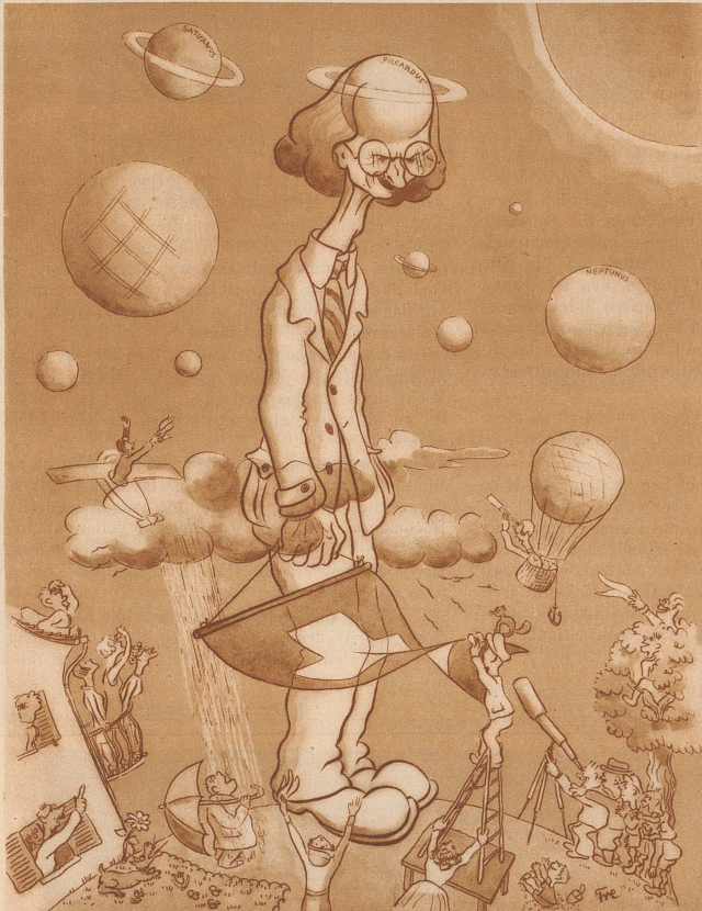
Professor Piccard verblüfft die Welt mit seinem Aufstieg in die Stratosphäre