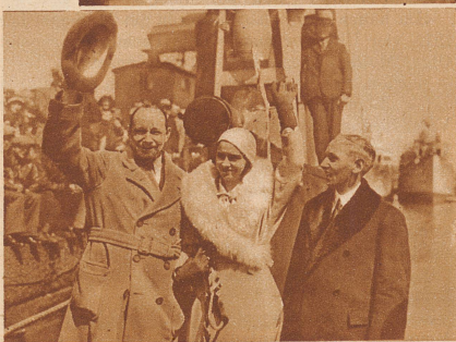
Von links nach rechts: Der Polarforscher Hubert Wilkins, Kommandant des «Nautilus», seine Gattin und der Enkel des Schriftstellers Jules Vernes, der die Expedition mitmachen wollte

Gründer und Seniorchef eines hochangesehenen Verlages, Schöpfer der weitherum im Schweizerland beliebten «Schweizer Wochen-Zeitung», wurde am 10. Juni 70 Jahre alt. Der Jubilar, ein Mann eigener Kraft, spielt heute im Verlegerverein, Buchdruckerverein und im Schweiz. Presseverein eine hervorragende Rolle.