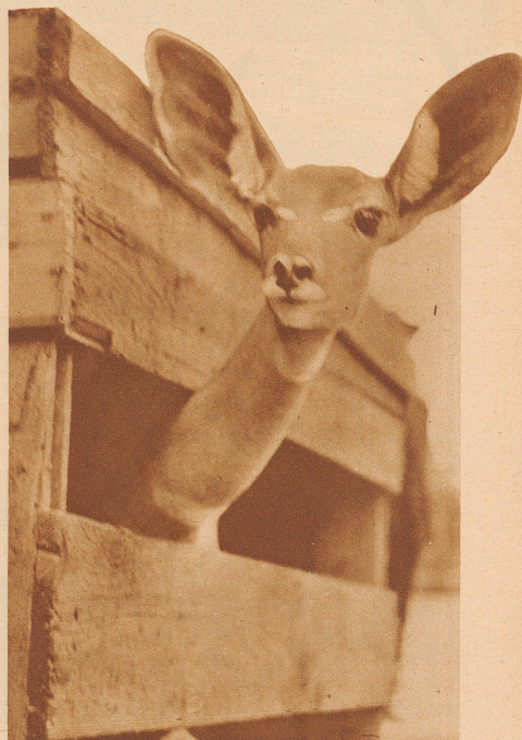
«Antilopenaugen sehen dich an!» — und man freut sich, wenn man den Blick dieser großen, sanften, spiegelnden Augen auf sich gerichtet fühlt. Stadt und Zoo sind um einen lieben, sympathischen Einwohner reicher

Mit großen, sanften Augen haben Zebra, Antilope und Giraffe den Transport aus einer fremden, heißen Welt in zürcherische Gefilde über sich ergehen lassen. Von neugierigen schwarzen Gesichtern begleitet, haben sie Addis Abeba verlassen; von neugierigen weißen Gesichtern eskortiert, haben sie in Zürich ihren Einzug gehalten. Nun wird das kaiserliche Geschenk hoffentlich lange Jahre jungen und alten Republikanern Freude machen!