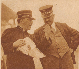
Ein nicht alltägliches Ereignis auf den S.B.B.: wie oft kommt es vor, daß man einen Frachtbrief in Händen hält «ausgestellt für Spedition, Verzollung und Ablieferung einer Giraffe, einer Antilope, eines Zebras und diverser anderer Tiere?»

Der Zürcher Zoo kann sich freuen und die ganze Schweiz mit ihm; sie haben ein fürstliches Geschenk entgegennehmen dürfen. Der braune Kaiser von Abessinien, Ras Tafari, der sich seit seiner feierlichen Krönung Haylé Selassi nennt, hat dem Zürcher Zoologischen Garten «ein ganzes Schiff voller Tiere» geschenkt; außer ein paar hundert Vögeln enthielt dieses Schiff sieben größere Tiere, von denen leider vier auf dem Transport von Marseille nach Lyon gestorben sind. Die drei anderen aber, die gesund