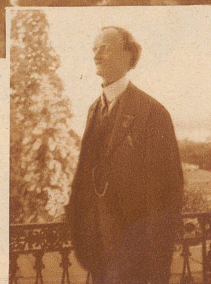
Bild rechts: Piccard, mehrere Male herausgerufen, begrüßt die enthusiastische Menge von der Terrasse des Hotel Baur au Lac aus

Die „Zürcher Illustrierte“ erscheint freitags • Schweizer Abonnementspreise: Vierteljährlich Fr. 3.30, halbjährlich Fr. 6.30, jährlich Fr. 12.—. Bei der Post 30 Cts. mehr. Postscheck-Konto für Abonnements: Zürich VIII 3790 • Auslands-Abonnementspreise: Beim Versand als Drucksache: Vierteljährlich Fr. 4.50 bzw. Fr. 5.25, halbjährlich Fr. 8.65 bzw. Fr. 10.20, jährlich Fr. 16.70 bzw. Fr. 19.80. In den Ländern des Weltpostvereins bei Bestellung am Postschalter etwas billiger. Insertionspreise: Die einspaltige Millimeterzeile Fr. —.60, fürs Ausland Fr. —.75; bei Platzvorschrift Fr. —.75, fürs Ausland Fr. 1.—. Schluß der Inseraten-Annahme: 14 Tage vor Erscheinen. Postscheck-Konto für Inserate: Zürich VIII 15769