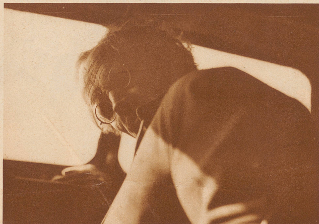
Piccard am Steuer des Flugzeuges, mit dem er von Augsburg nach Dübendorf flog