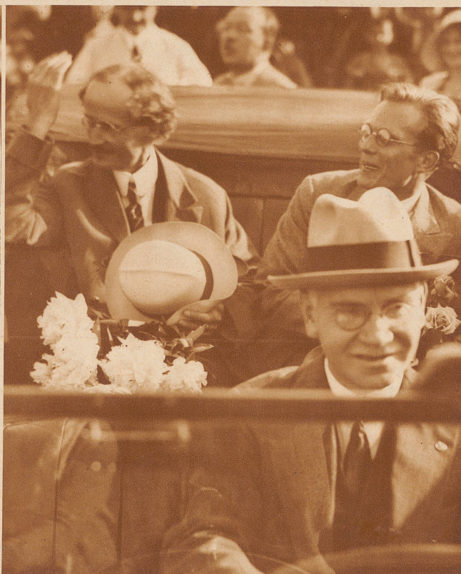
Piccard und Kipfer begrüßen auf der Fahrt durch die beflaggte Bahnhofstraße die spalterstehende Zürcher Bevölkerung