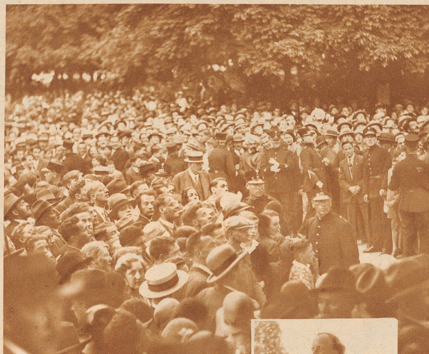
Auch vor dem Hotel Baur au Lac, wo Piccard abstieg und zu seinen Ehren ein offizieller Empfang stattfand, wurde der Forscher Gegenstand begeisterter Kundgebungen