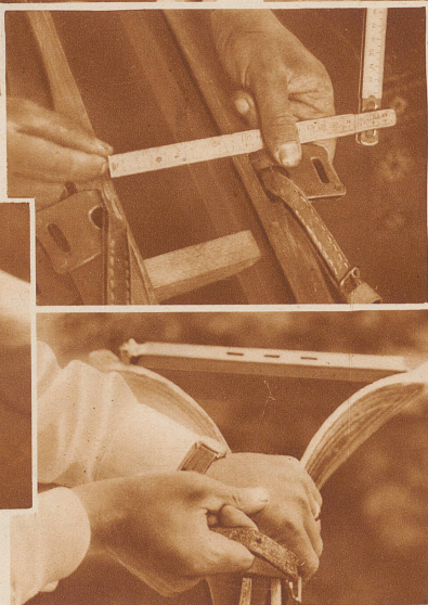
Bild rechts: Zwischen die Spitzen wird ein Spannholz gepreßt und mittelst eines Riemens gespannt. Auch das untere Ende wird Gleitfläche gegen Gleitfläche mit einem Riemen gebunden