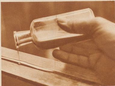
Erst wird die Gleitfläche mit einem Stück Glas vom alten Wachs gesäubert. Dann läßt man das Holz sich an Leinöl satttrinken, Leder- und Eisenteile sind gut einzufetten