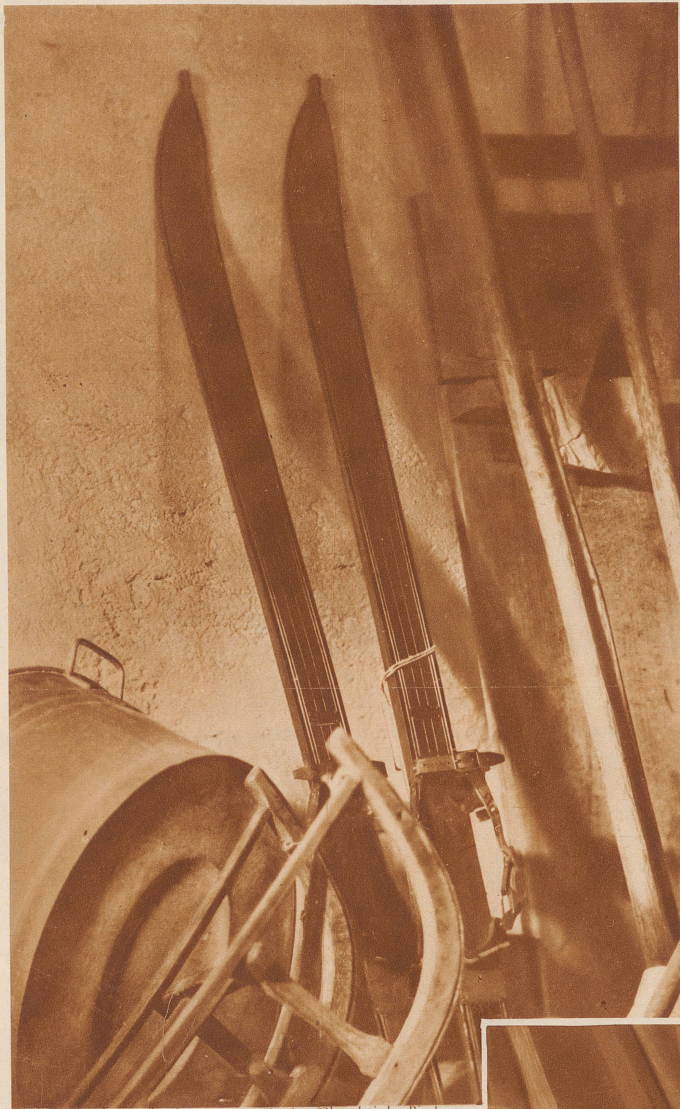
Ungespannt und ungepflegt im Keller - ein Anblick, der uns das Wasser in die Augen treibt