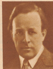
Emil Ludwig , der in Ronco am Lago Maggiore wohnt. Die Leser aller Länder kennen ihn als den erfolgreichen Verfasser biographischer Darstellungen großer Männer — Goethe, Napoleon, Christus, Wilhelm II., Abraham Lincoln — und als Schöpfer einer besonderen Art solcher Darstellungen.

Am Anfang jedes Erfolgs, aller Kraft, allen Glücks steht die Selbsterkenntnis. Selbsterkenntnis ist schwer. Vieles versperrt ihr den Weg, zum Beispiel die Eitelkeit, oder die Lobgespräche, die wir erhalten. Wir Schweizer sind ziemlich verwöhnte Leute, als Nation gewohnt Lob zu empfangen. — In der Berliner Zeitschrift «Das Tagebuch» hat uns in der Nr. 14 vom 4. April 1931 der Schriftsteller Ilja Ehrenburg einige unangenehme Wahrheiten gesagt. Dann ist uns in der Nr. 17 der gleichen Zeitschrift in Emil Ludwig ein Verteidiger erstanden. Die «Zürcher Illustrierte» setzt (auszugsweise) hier die zwei Stimmen gegeneinander. — Wer sich links ärgert, lese rechts, und umgekehrt! — «Erkenne Dich selbst!»