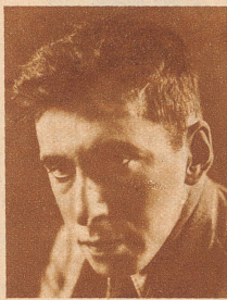
Ilja Ehrenburg , ein junger russischer Schriftsteller, der in Paris lebt, ist bekannt geworden durch seinen großen, trotz aller Schwächen faszinierenden Roman: «Die Liebe der Jeanne Ney», und durch seinen letzten Reportage-Roman «Das Leben der Automobile». Ehrenburg reist viel und veröffentlicht von Zeit zu Zeit beiseide Beobachtungen über die verschiedensten Länder. Die Schweiz ist nicht das einzige Land, an dem er eine scharfe Kritik übt.

Am Anfang jedes Erfolgs, aller Kraft, allen Glücks steht die Selbsterkenntnis. Selbsterkenntnis ist schwer. Vieles versperrt ihr den Weg, zum Beispiel die Eitelkeit, oder die Lobgespräche, die wir erhalten. Wir Schweizer sind ziemlich verwöhnte Leute, als Nation gewohnt Lob zu empfangen. — In der Berliner Zeitschrift «Das Tagebuch» hat uns in der Nr. 14 vom 4. April 1931 der Schriftsteller Ilja Ehrenburg einige unangenehme Wahrheiten gesagt. Dann ist uns in der Nr. 17 der gleichen Zeitschrift in Emil Ludwig ein Verteidiger erstanden. Die «Zürcher Illustrierte» setzt (auszugsweise) hier die zwei Stimmen gegeneinander. — Wer sich links ärgert, lese rechts, und umgekehrt! — «Erkenne Dich selbst!»