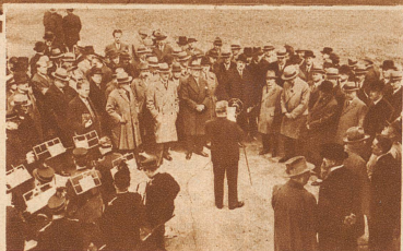
Mit Reden und Musikvorträgen vor dem Mikrofon wurde am 3. April der westschweizerische Landessender, der zweite Grundpfeiler des schweizerischen Rundspruchsendernetzes, in Sottens eröffnet

Das schweizerische Radiowesen ist seit dem Frühjahr 1931 in verheißungsvollem Aufstieg begriffen. Das Rundspruch-Sendernetz wurde ausgebaut und das gesamte Radiowesen neu organisiert. — Die gebirgige Natur des Landes und die sprachlichen Verhältnisse der Schweiz erschweren einen systematischen Ausbau des Sendernetzes. Die Landessender Beromünster und Sottens entstanden als die Grundpfeiler des schweizerischen Rundspruchsendernetzes nördlich der Alpen. — Während der westschweizerische Landessender in Sottens in Betrieb gegeben wurde, ist nun auch Beromünster eröffnet worden. Der deutschschweizerische Landessender steht mit seinen zwei schlanken 125 m hohen Antennentürmen und dem Stationsgebäude auf der Hügelkuppe zwischen Sempacher- und Baldegersee oberhalb Münster. Er ist ein Wunderwerk der Technik und wird bald in ganz Europa Zeugnis ablegen von deutschschweizerischer Eigenart und Kultur.