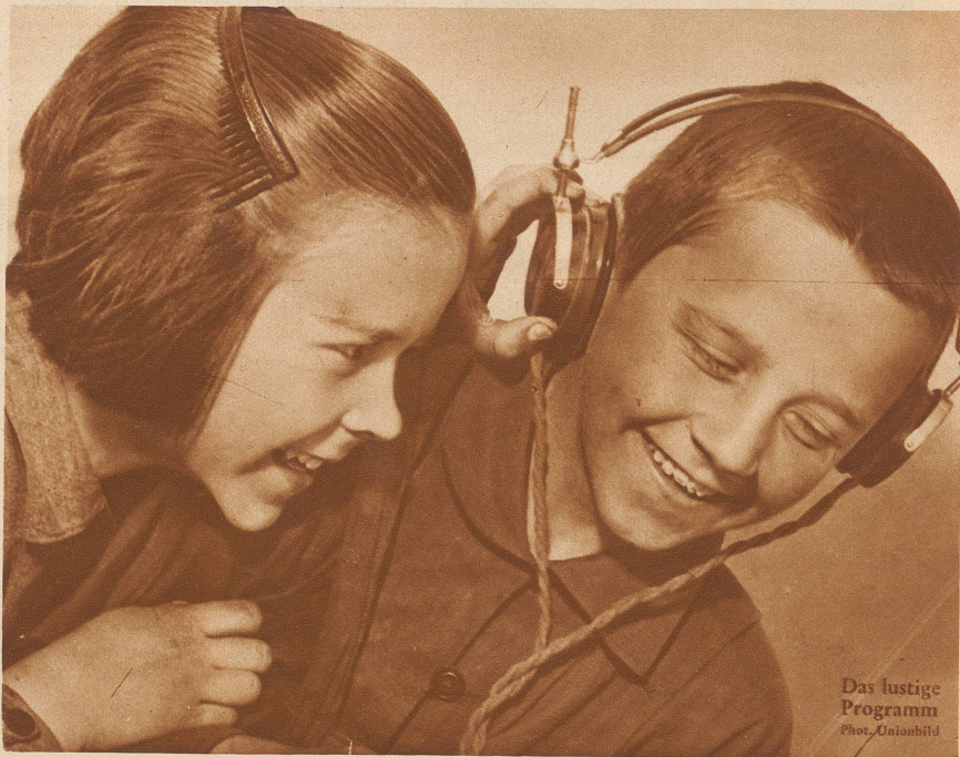
Das lustige Programm

Die „Zürcher Illustrierte“ erscheint Freitags • Schweizer Abonnementspreise: Vierteljährlich Fr. 3.30, halbjährlich Fr. 6.30, jährlich Fr. 12.—. Bei der Post 30 Cts. mehr. Postscheck-Konto für Abonnements: Zürich VIII 3790 • Auslands-Abonnementspreise: Beim Versand als Drucksache: Vierteljährlich Fr. 4.50 bzw. Fr. 5.25, halbjährlich Fr. 8.65 bzw. Fr. 10.20, jährlich Fr. 16.70 bzw. Fr. 19.80. In den Ländern des Weltpostvereins bei Bestellung am Postschalter etwas billiger. Insertionspreise: Die einspaltige Millimeterzeile Fr. —.60, fürs Ausland Fr. —.75; bei Platzvorschrift Fr. —.75, fürs Ausland Fr. 1.—. Schluß der Inseraten-Aufnahme: 14 Tage vor Erscheinen. Postscheck-Konto für Inserate: Zürich VIII 15769