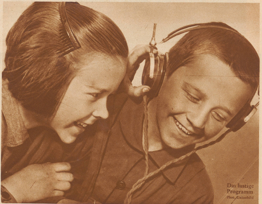
Das lustige Programm

Das schweizerische Radiowesen ist seit dem Frühjahr 1931 in verheißungsvollem Aufstieg begriffen. Das Rundspruch-Sendernetz wurde ausgebaut und das gesamte Radiowesen neu organisiert. — Die gebirgige Natur des Landes und die sprachlichen Verhältnisse der Schweiz erschweren einen systematischen Ausbau des Sendernetzes. Die Landessender Beromünster und Sottens entstanden als die Grundpfeiler des schweizerischen Rundspruchsendernetzes nördlich der Alpen. — Während der westschweizerische Landessender in Sottens in Betrieb gegeben wurde, ist nun auch Beromünster eröffnet worden. Der deutschschweizerische Landessender steht mit seinen zwei schlanken 125 m hohen Antennentürmen und dem Stationsgebäude auf der Hügelkuppe zwischen Sempacher- und Baldegersee oberhalb Münster. Er ist ein Wunderwerk der Technik und wird bald in ganz Europa Zeugnis ablegen von deutschschweizerischer Eigenart und Kultur.